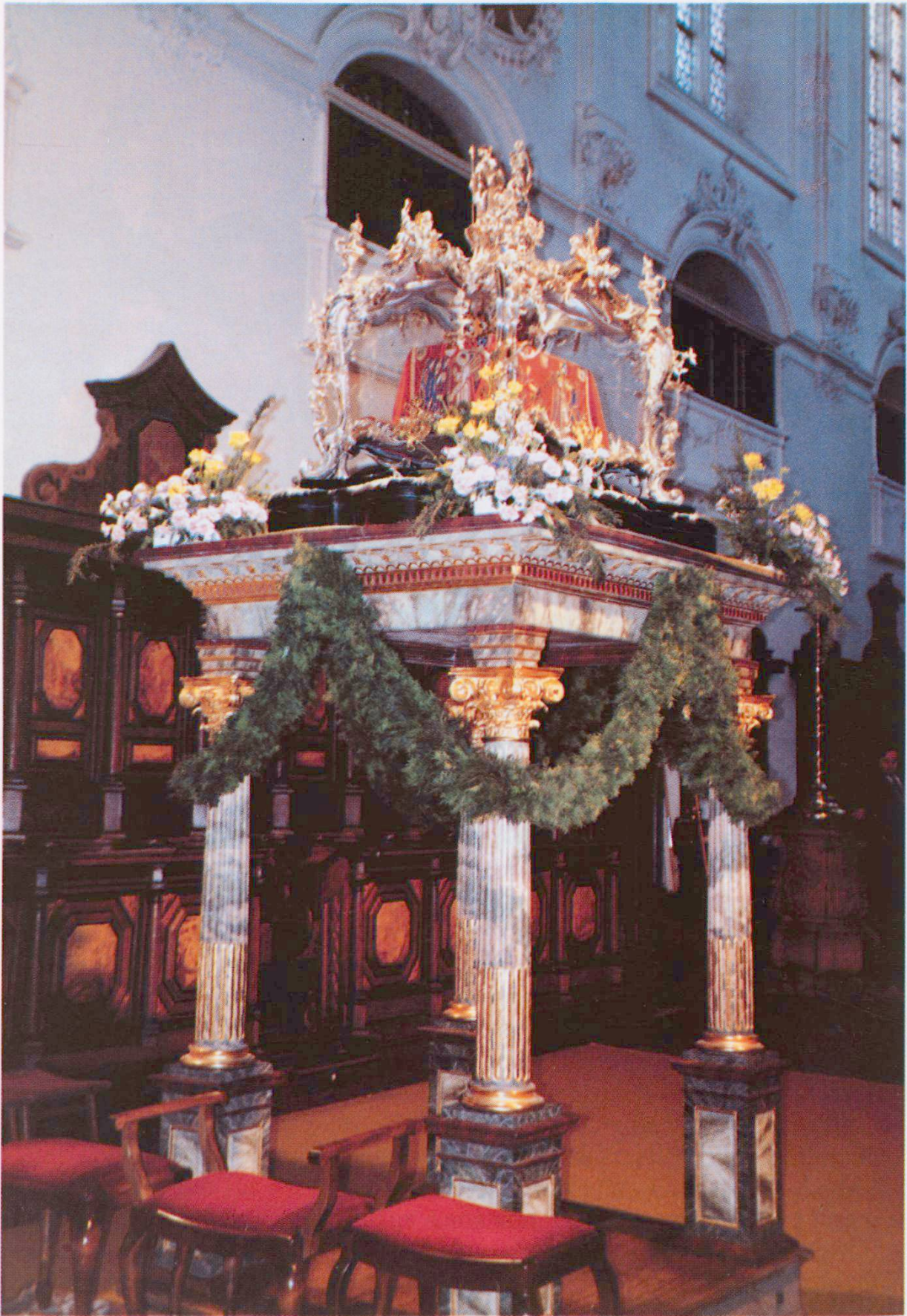
Der Schrein mit den Gebeinen des Hl. Fridolin im Münster zu Bad Säckingen.