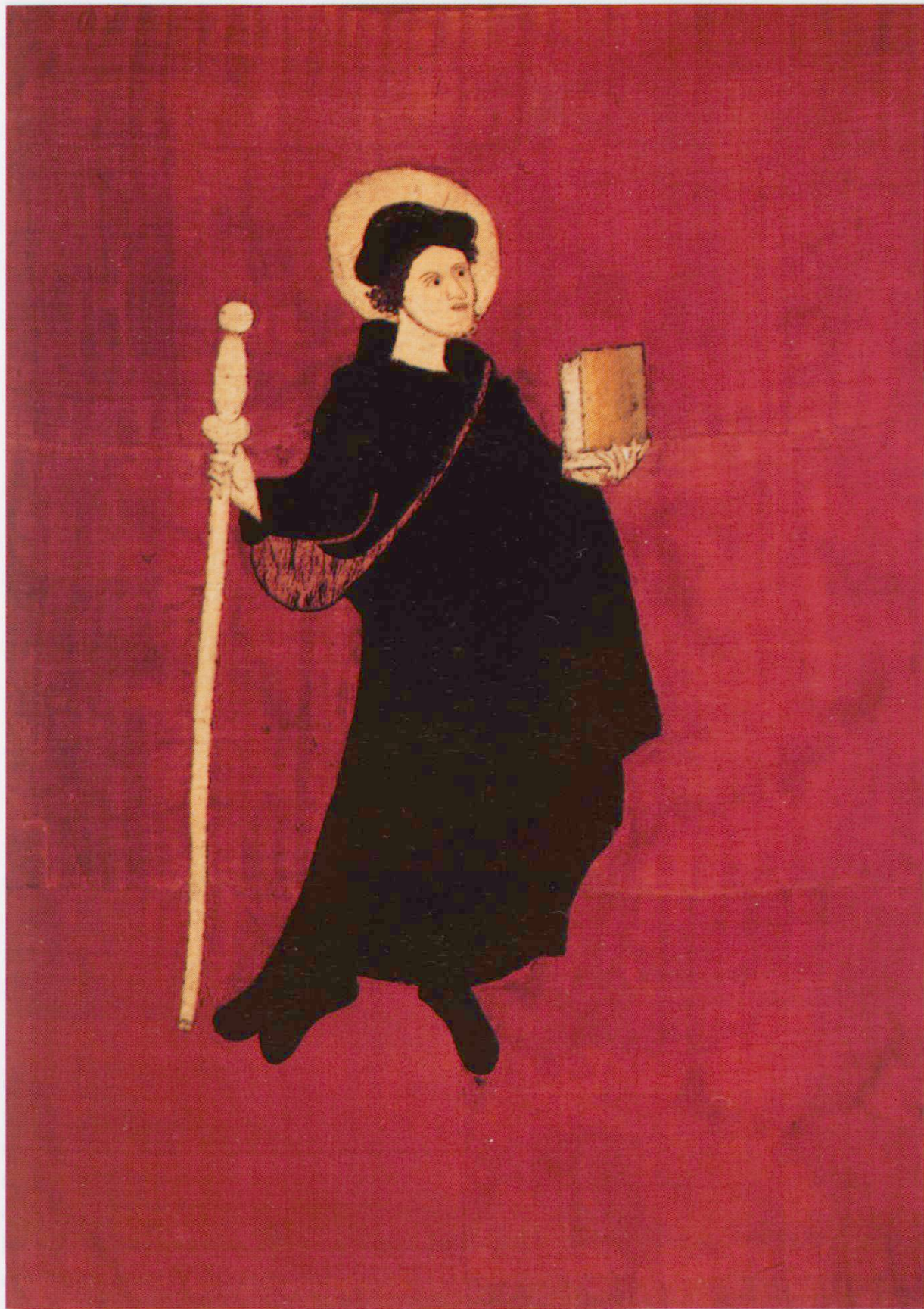
Alte Glarner Fahne (Freulerpalast Näfels)