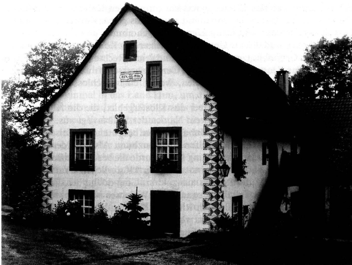
Renovierte Säckinger Fronmühle zu Kaisten, mit dem Wappen der letzten Fürststäbtissin von Säckingen

Am lebendigsten ist bis heute in Glarus die Erinnerung an die einstige Zugehörigkeit zum Kloster des hl. Fridolin in Säckingen geblieben. Bis zum Jahre 1395 gehörte die ganze Talschaft Glarus, fast das ganze Gebiet des heutigen Kantons, zu Säckingen 162 . Wann das Stift diesen Besitz erwarb, ist nicht mehr festzustellen. Er geht in sehr frühe Zeit zurück und dürfte wohl als königliches