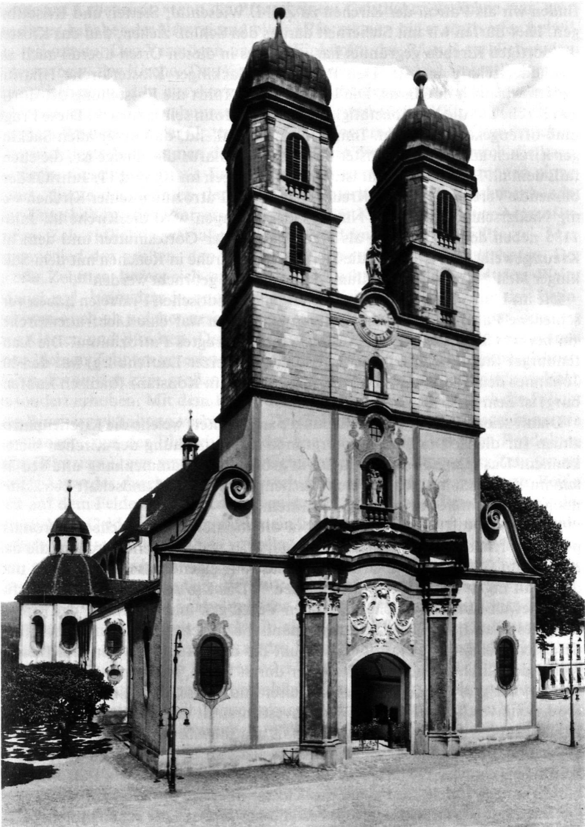
St. Fridolinmünster zu Bad Säckingen