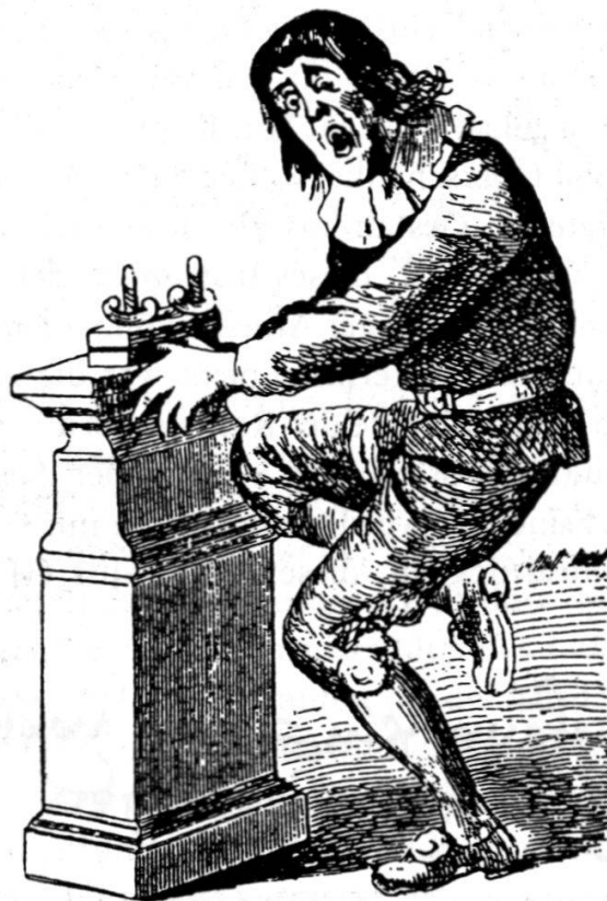
Abb. 8 Daumenschraubenstock