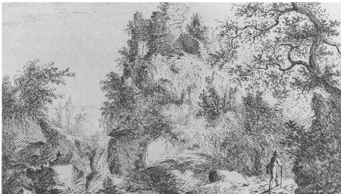
Abb. 99 Die Ruine Tegerfelden. Blatt Nr. 115 aus der Topographie der Eidgenossenschaft von David Herrliberger 1756. Die Burg stammt wahrscheinlich aus dem 11. Jahrhundert, wird aber schon im 15. Jahrhundert als Burgstall bezeichnet und dürfte somit bereits Ruine gewesen sein.