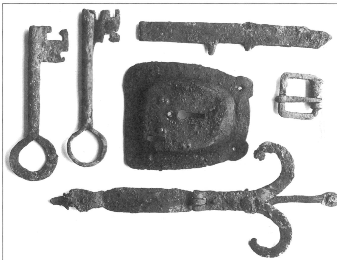
Abb. 100 Schlüsselblech, Schlüssel, Türbänder und Gürtelschnalle aus der Ruine Tegerfelden, gefunden bei der Ausgrabung und Sicherung der Ruine 1948–1950 (Bezirksmuseum Zurzach)