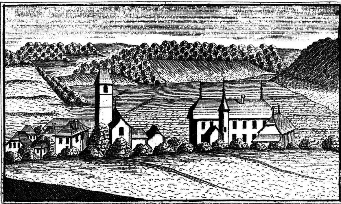
39 Schloss Schöffland (mit Kirche) im Besitz der Familie von May. Wird im Laufe der Helvetik zum Mittelpunkt der antirevolutionären Bestrebungen im Bezirk Kulm. Kupferstich von Johann Ludwig Nötiger, um 1740.