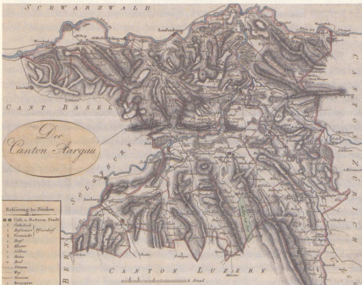
Karte des Kantons Aargau von Johann Jakob Scheuermann von 1803. Sie wurde von der Gesellschaft für vaterländische Kultur 1816 mit dem Neujahrsblatt für die aargauische Jugend als willkommenes Geschenk an die Schulen verteilt. 25

Geplant war ein Neujahrsblatt für die aargauische Jugend nach der Art der Zürcher Neujahrsblätter, zur «Förderung der Vaterlandsliebe und des Vaterlandsstolzes». 24 Die erste Ausgabe erschien für das Jahr 1816 mit dem Titel «Umriss der Geschichte des Aargaues» in 1 200 Exemplaren im Verlag Sauerländer;