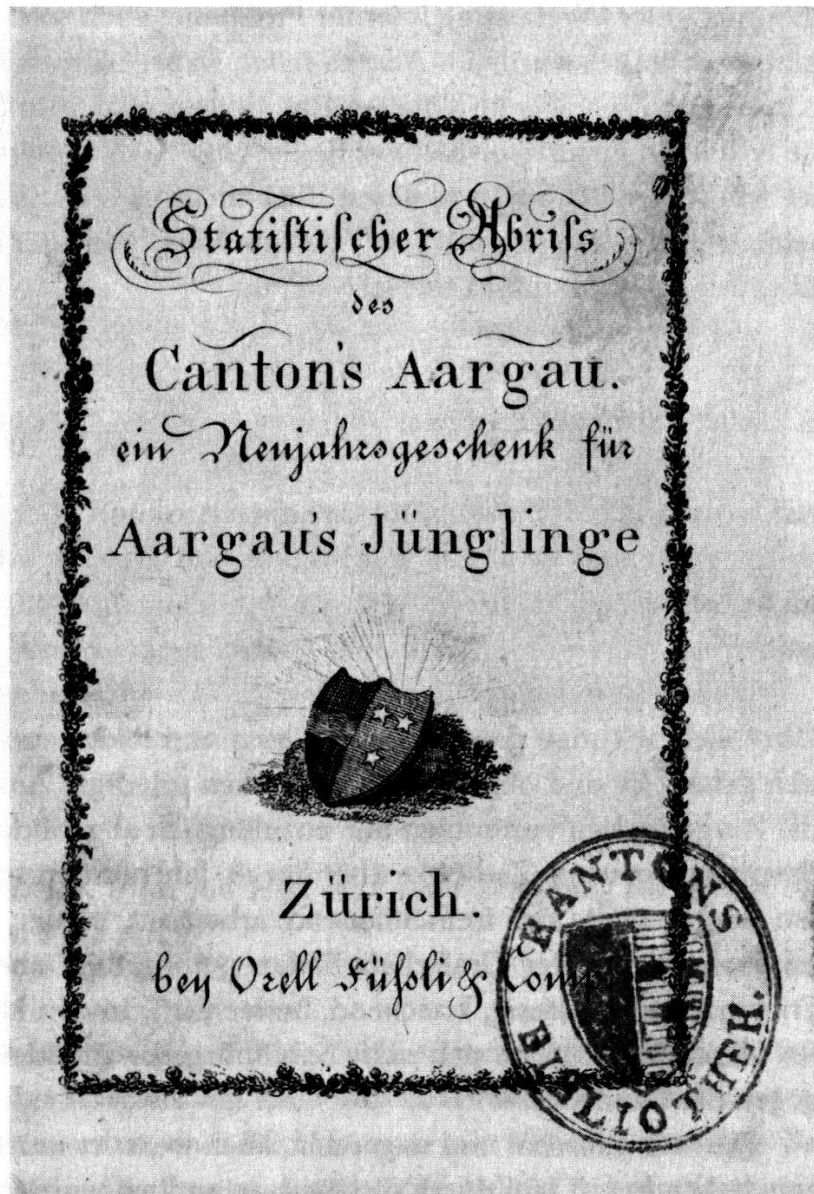
Titelblatt des Helvetischen Almanachs von 1816 in einer Sonderausgabe für die Aargauer Jugend. 34

manach war der Präsentierteller, auf dem der Staat Aargau zum ersten Mal vor eine kritische Öffentlichkeit trat.