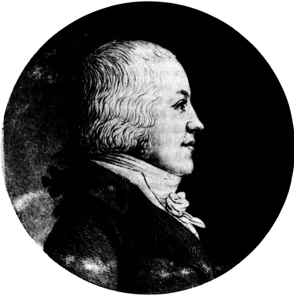
Abraham Gottlieb Jenner, Gesandter der Helvetischen Republik in Paris 1800. Radierung von Jean Fouquet, Paris, um 1800.

lösen. Hauptsorge allerdings war die möglichst reibungslose Bewältigung der innenpolitischen Krise durch die Vertagung der gesetzgebenden Räte. 31 Diese Aktion gelang denn auch, und es blieb ruhig im Land, wie Frisching im oben erwähnten Schreiben an Stapfer vom 10. August berichtete und dessen baldige Rückkehr ins Ministerium erwartete. Doch am 5. September tönte es in einem Brief von dessen Stellvertreter Wild wieder anders, denn dieser rechnete offenbar nicht mit einer baldigen Ablösung und meldete, er habe, weil selber anderweitig beansprucht, Stapfers Posten mit einem anderen Freund besetzt: 32