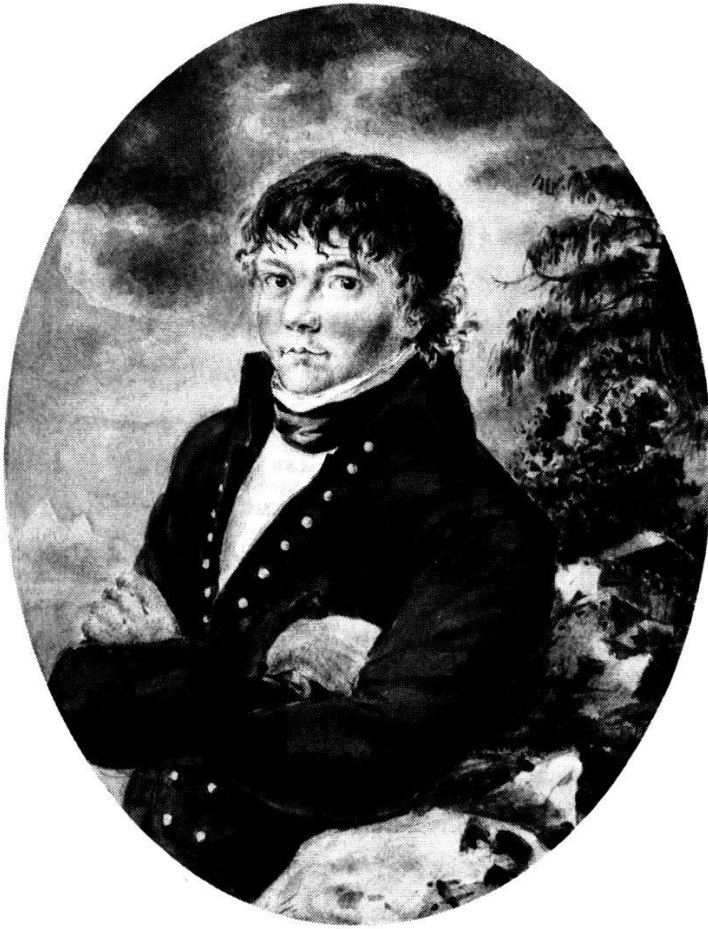
Heinrich Zschokke (1771–1848) als Regierungsstatthalter in Basel 1800/01, unbekannter Maler.

fers. 21 Der von ihm in der Planung gesetzte Zweck wird hier folgendermassen umschrieben: