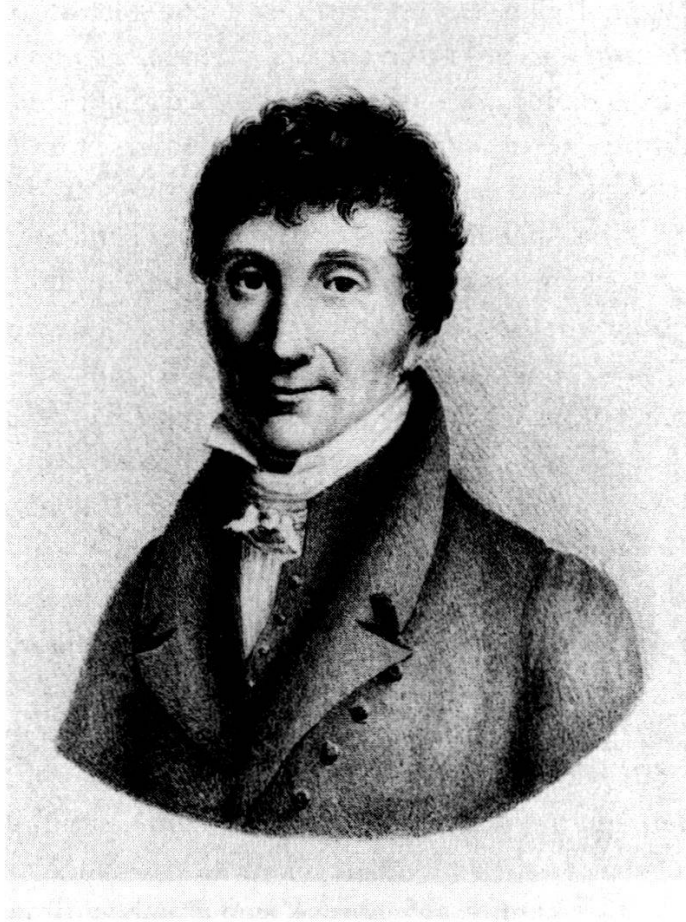
Frédéric-César de Laharpe (1754–1838), Direktor der Helvetischen Republik. Lithografie von unbekannter Hand.

sondere mit dem Finanzminister ins Gericht, kritisierte aber auch den Innen-, den Justiz- und den Kriegsminister, erwähnte hingegen den Erziehungsminister mit keinem Wort. 17 Dessen Departement war unter den damals waltenden Umständen freilich am wenigsten exponiert. Laharpe hatte allerdings das politische System als Ganzes im Auge und verschonte mit seiner Kritik nicht einmal den allgemein anerkannten und ihm freundschaftlich verbundenen Innenminister Rengger. Gesinnungsmässig standen nämlich die Minister Finsler, Meyer von Schauensee, Rengger, wie übrigens auch Stapfer, der gemässigten Mittelpartei in den gesetzgebenden Räten näher als dem Radikalkurs Laharpes. Dieser hatte denn auch den Bogen überspannt, und da er mit seinen Bestrebungen auch beim Brumaire-Putschisten Bonaparte nicht den erhofften Rückhalt bekam, wurde er im Januar 1800 durch den ersten Staatsstreich gestürzt und verschwand wie Ochs von der politischen Bühne. Die Folgen des Schreckensjahres 1799 markierten solchermassen den beginnenden Niedergang der Helvetischen Republik.