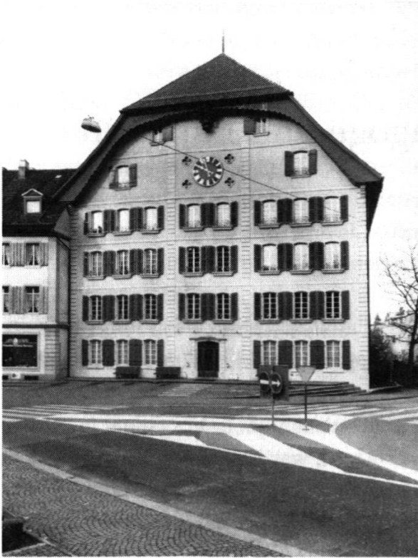
Das Schulhaus in Lenzburg, das ab 1835 dem kantonalen Lehrerseminar unter der Führung von Augustin Keller diente.