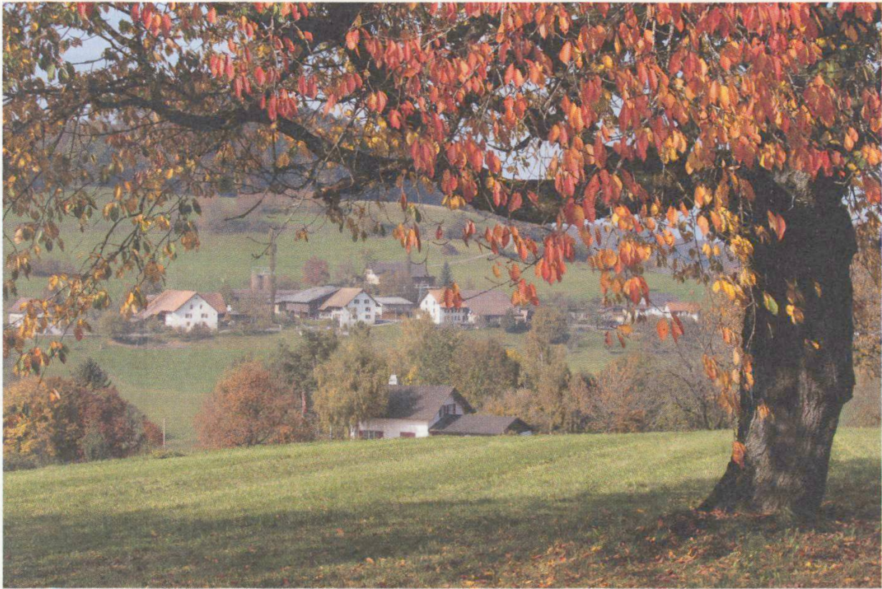
Zu den Hauptauswanderungsgebieten gehörte auch das im südlichen Aargau gelegene Ruedertal mit seinen Dörfern und weit verstreuten Weilern. Hier ein Blick auf den Weiler Löhren.