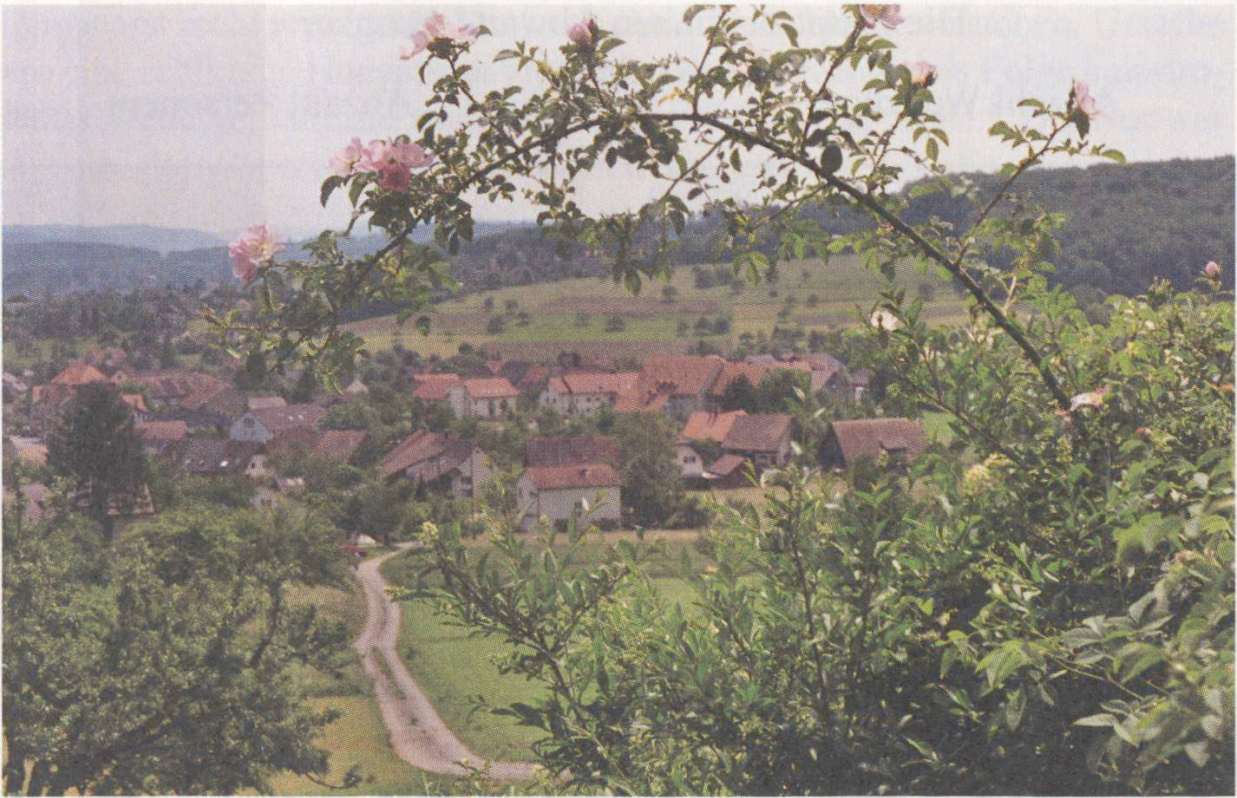
Das weitaus grösste Auswanderer-Kontingent im 17. Jahrhundert stammte aus Küttigen am Südfuss des Juras. Das Bild zeigt den Blick auf den unteren Dorfteil.

gehenden Abschnitt nur die in unseren relativ wenigen Quellen tatsächlich auftretenden Auswanderer. Für unsere Untersuchung halten wir zunächst fest, wie oft während des halben Jahrhunderts ein Ort einen Wegzug erlebte. Wir addieren dabei ganz einfach Leute, die mit ihrer Familie wegzogen, und solche, die sich allein aufmachten. Reisten mehrere Familien oder verschiedene Einzelpersonen aus einer Ortschaft um die gleiche Zeit weg, zählen wir sie mehrfach.