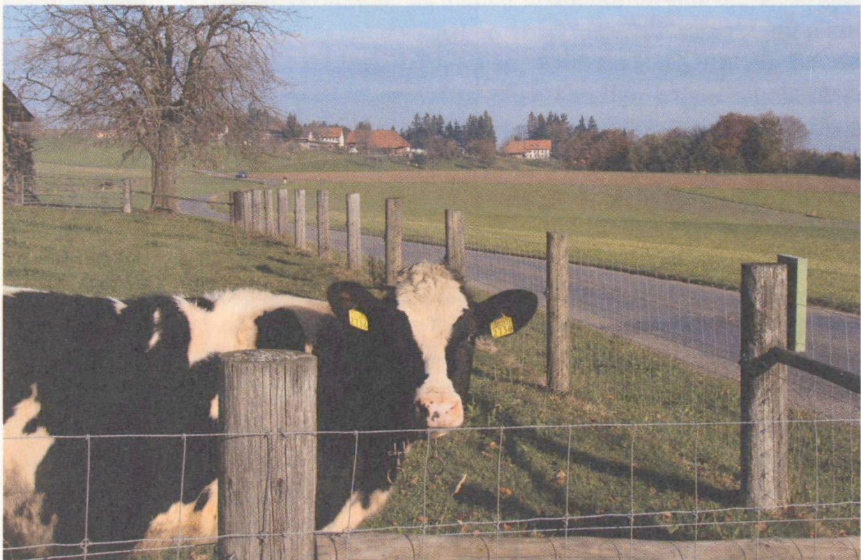
Die Weiler im Ruedertal befinden sich teils in Hanglage, teils auf Hochebenen. Hier blicken wir vom Weiler Steinig auf Waltersholz.