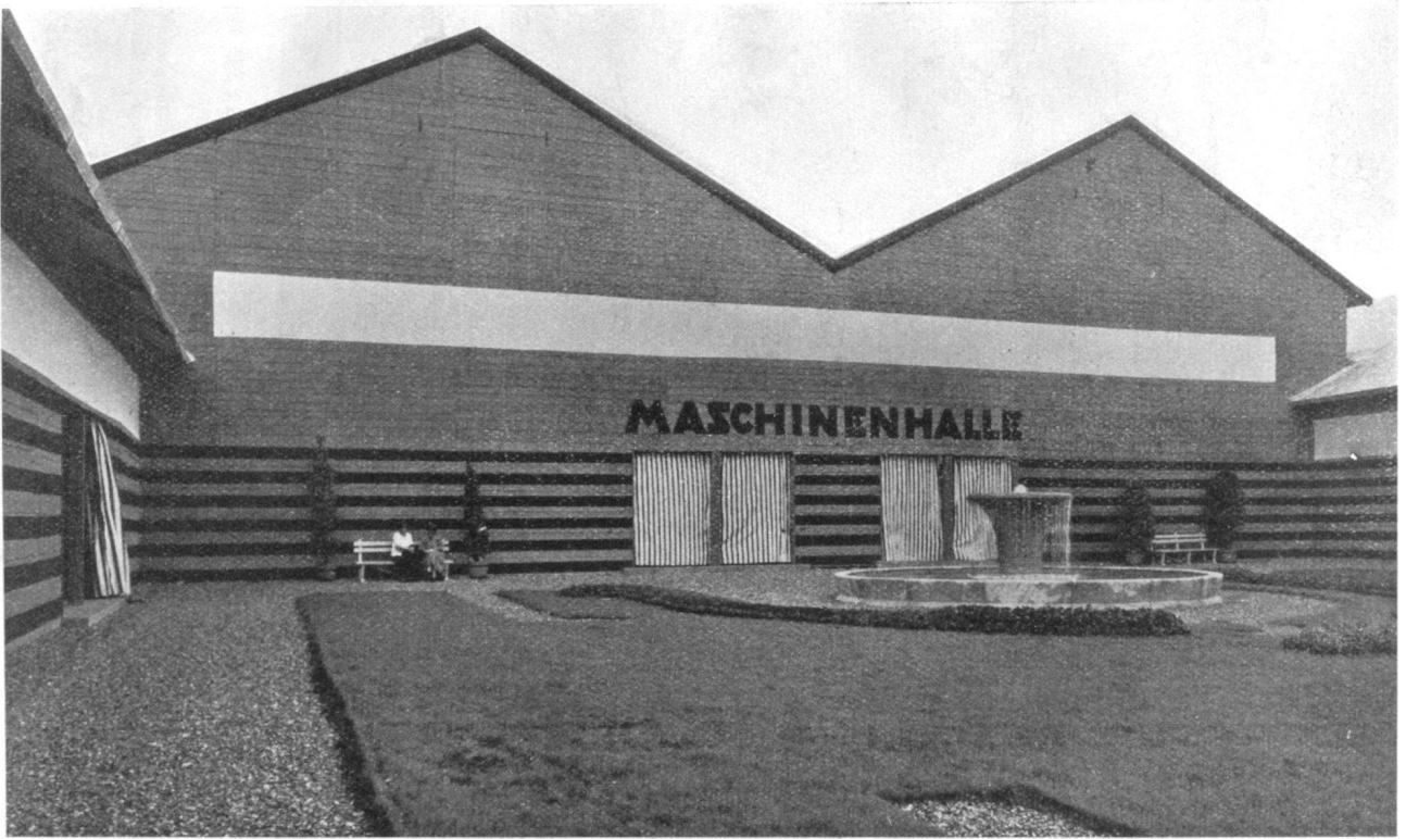
DER GROSSE HOF / DETAIL