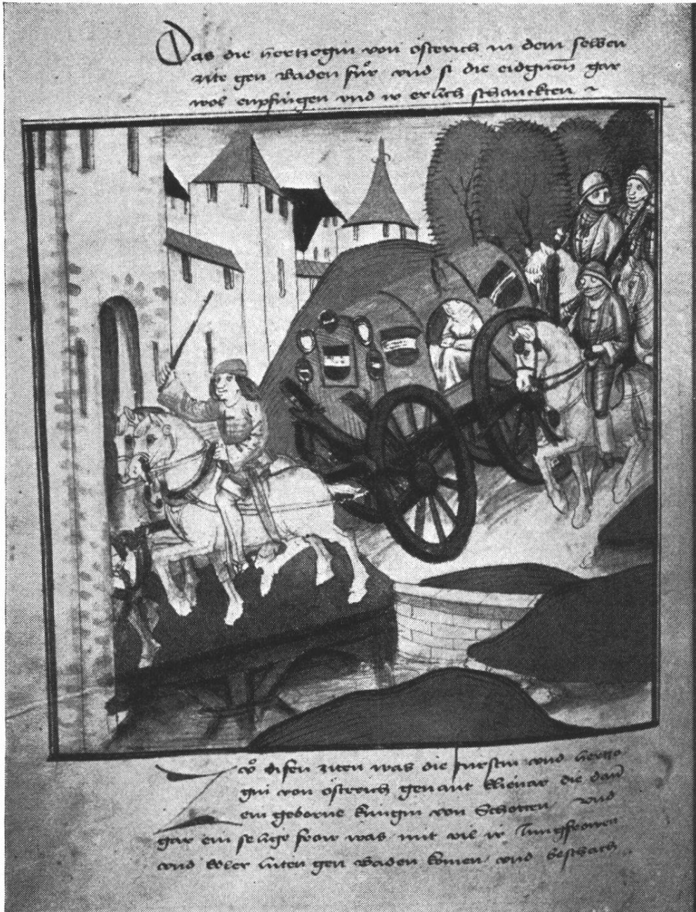
Die Badensfahrt der Herzogin Eleonore von Desterreich, 1474.

von einem doctor verordnet / essen vor ingang des bads. Item keiner sitz ins bad uff das essent / verziehe //// oder fünft stund / bis der mag die Kost merteilß verdeüwet / oder zum minsten wol angenommen hat."