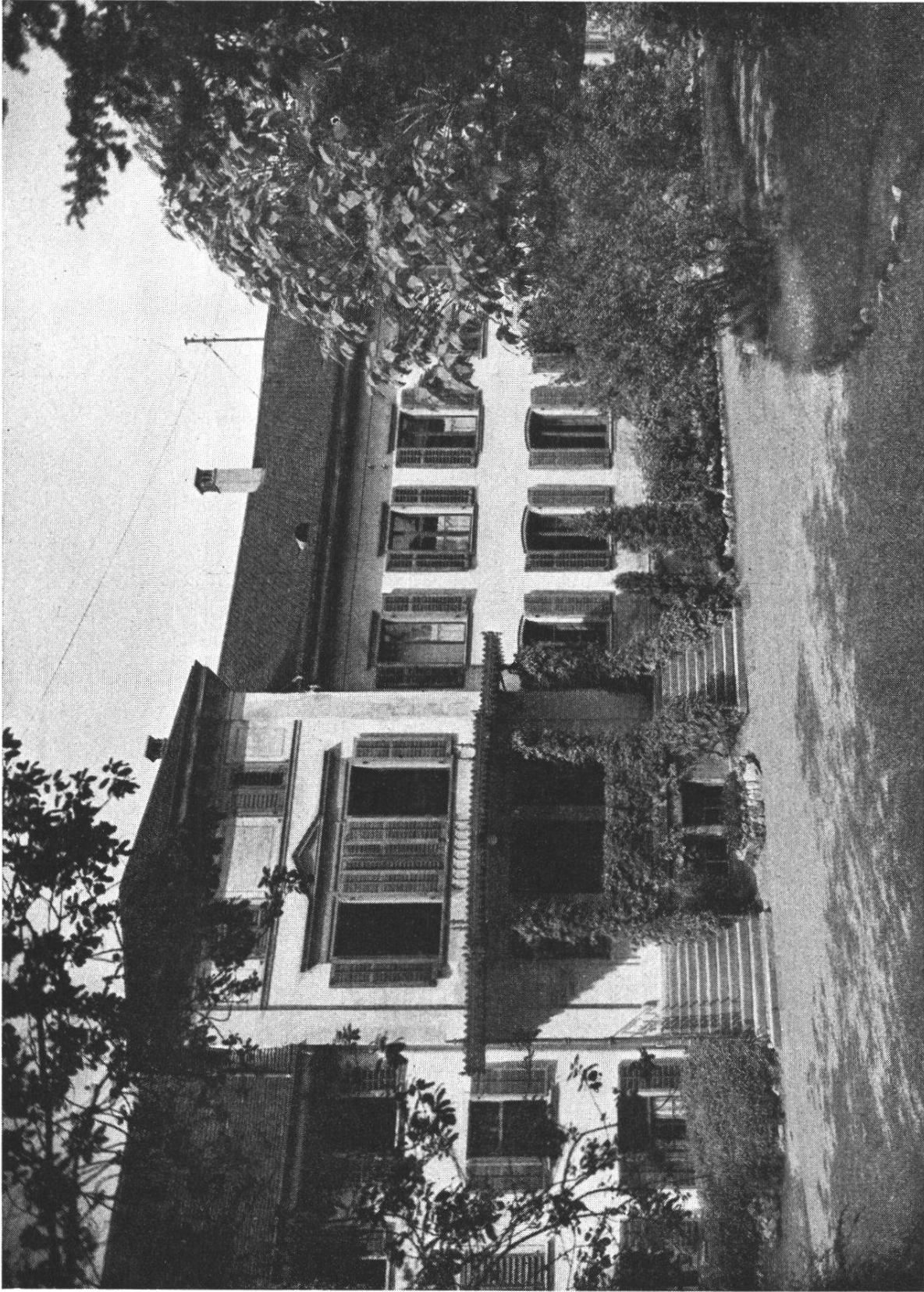
Der historische „Hinterhof“, in dem das Institut für Fango eingerichtet ist