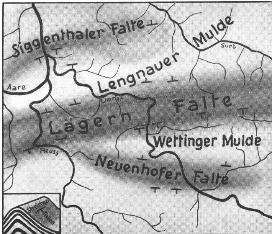
Tektonische Skizze. Die Lägerenkette mit zwei Nebenfalten trennt den im Norden liegenden Tafeljura vom südlich gelegenen Mittelland.

brachte Skizze zeigt, wie das Relief nach der Jurafaltung ungefähr ausgesehen haben würde, falls nicht die Abtragung schon während der Krustenbewegungen die Regelmässigkeit gestört hätte. Die flugzeugähnlichen Figuren sind Fallzeichen, welche die Neigung der Schichten angeben. So sehen wir unterhalb des Aare-, Reuss-, Limmatzusammenflusses die Schichten des Tafeljuras plötzlich stark abgelenkt. Es handelt sich um eine Störung, die von Mühlberg als Endinger-Flexur bezeichnet wurde. A. Amsler hat aber später nachgewiesen, dass es sich nicht nur um eine plötzliche Abbiegung der Tafeljura-