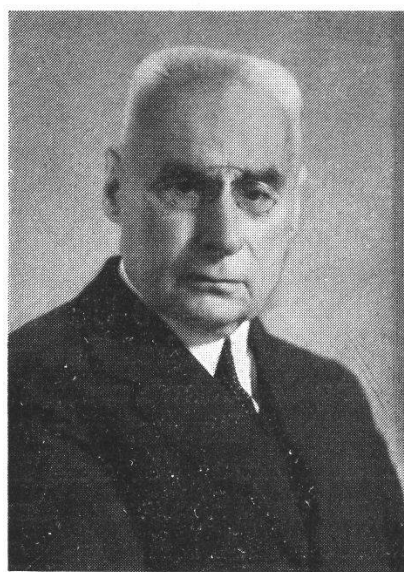
S. W. Brown 1865—1941

durchschnittlich 3,43 Personen, sodass also rund 25 000 Menschen direkt von der Arbeit des Unternehmens leben. Der ganze Konzern von Brown Boveri beschäftigt rund 40 000 Personen, eine Zahl, die auch die Bedeutung der Firma auf dem Weltmarkt unterstreicht.