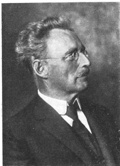
C. E. L. Brown 1863—1924

Es ist nicht möglich im Rahmen dieses Aufsatzes alle die technischen Pionierleistungen zu würdigen, welche die Firma in den ersten 50 Jahren ihres Bestehens hervorgebracht hat. Diese Leistungen tragen oft recht persönlichen Charakter, auf alle Fälle und bestimmt immer das Kennzeichen zäher Forschung, welche die Seele bildet. Hervorragende Männer und