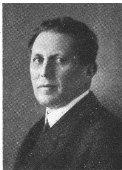
W. Boveri 1865—1924

eine ausgezeichnet geschulte Arbeiterschaft haben selbst in wirtschaftlichen schweren Krisenzeiten in ununterbrochenem technischem Aufstieg die Firma zu einem Weltunternehmen von grösstem Ansehen gemacht.