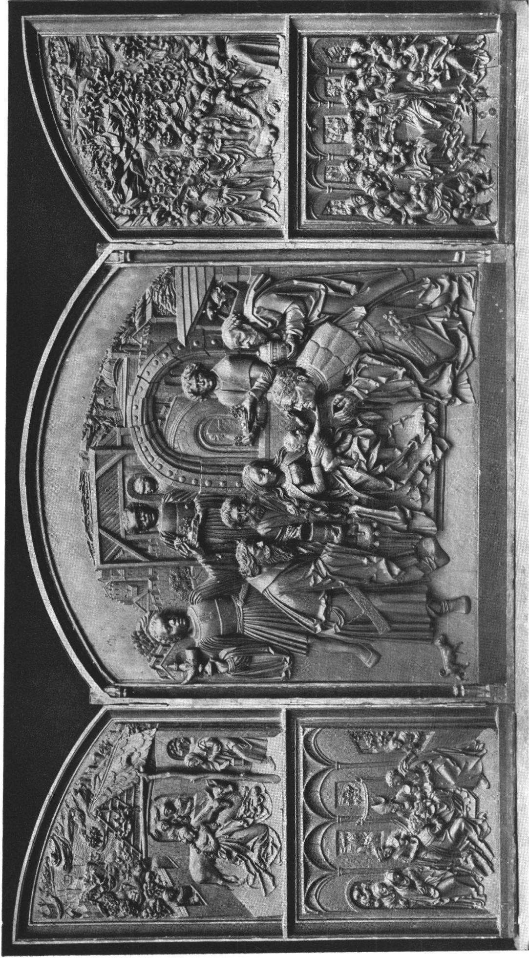
Abb. 2. Dreikönigsaltar von 1516. Berlin, Deutsches Museum; seit ca. 1944: Düsseldorf, Museum.

Mittelbild: Anbetung der Drei Könige; linker Flügel: Geburt und Beschneidung Christi; rechter Flügel: Hl. Familie und 10 000 Märtyrer.