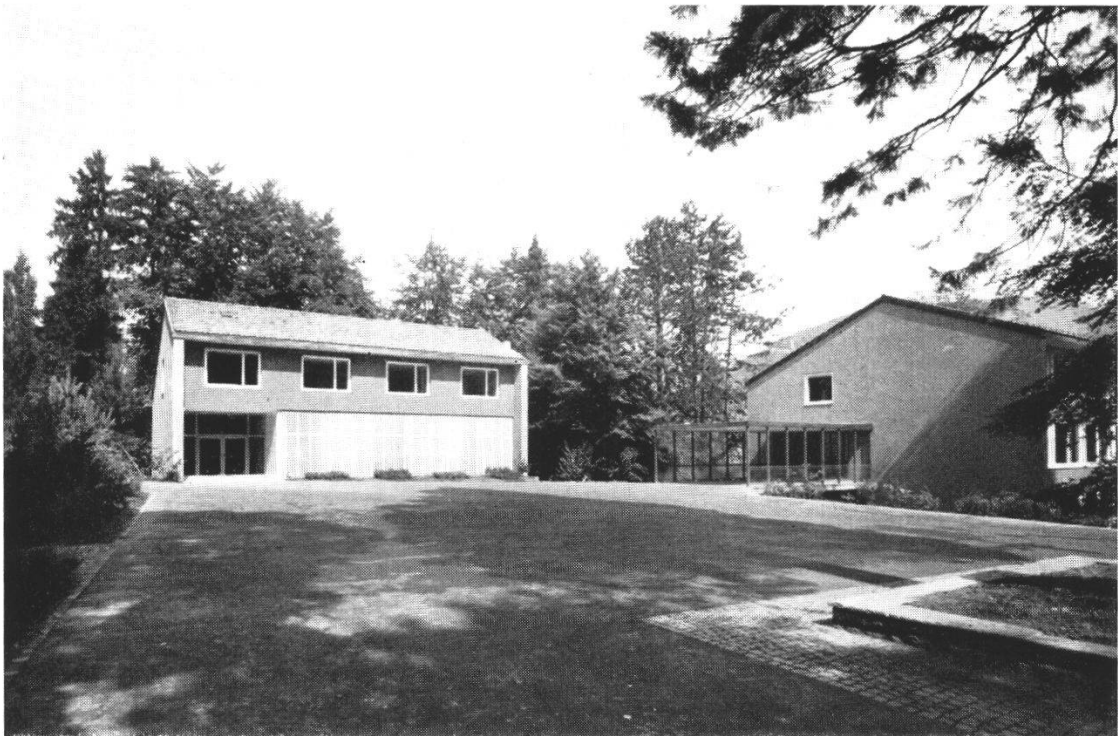
Der neue Pausenplatz mit Singsaal und Schulhaus. Die alten Parkbäume wurden nach Möglichkeit geschont.