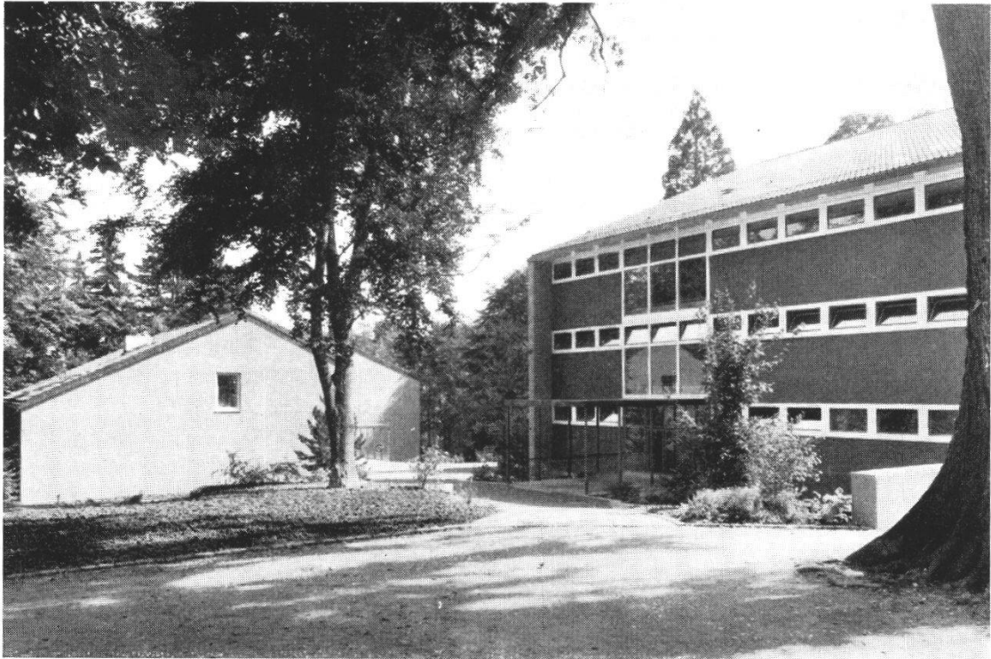
Links Singsaal und Abwartwohnung, hinten Schulhaus, rechts die Rückfront der Turnhalle, gegen Osten gesehen.