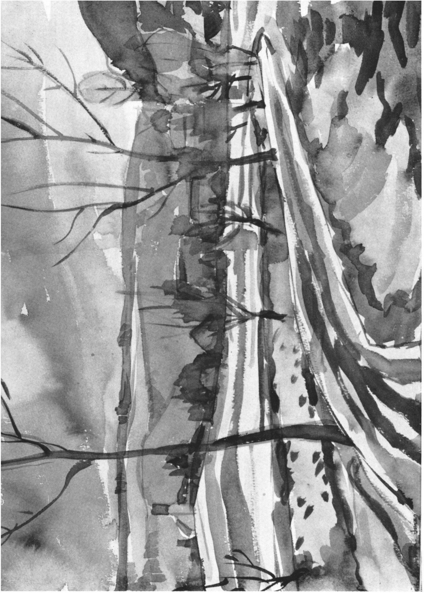
Vorfrühling bei Würenlos