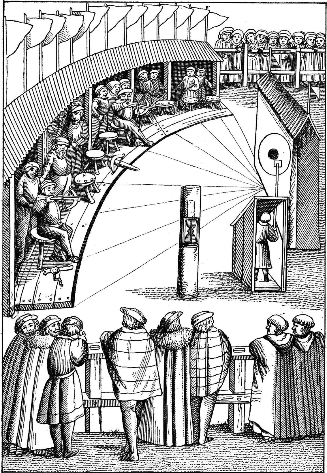
Die zilstatt der armbrust schützen ze Zürich den zwölften tag ougstmonats 1504.