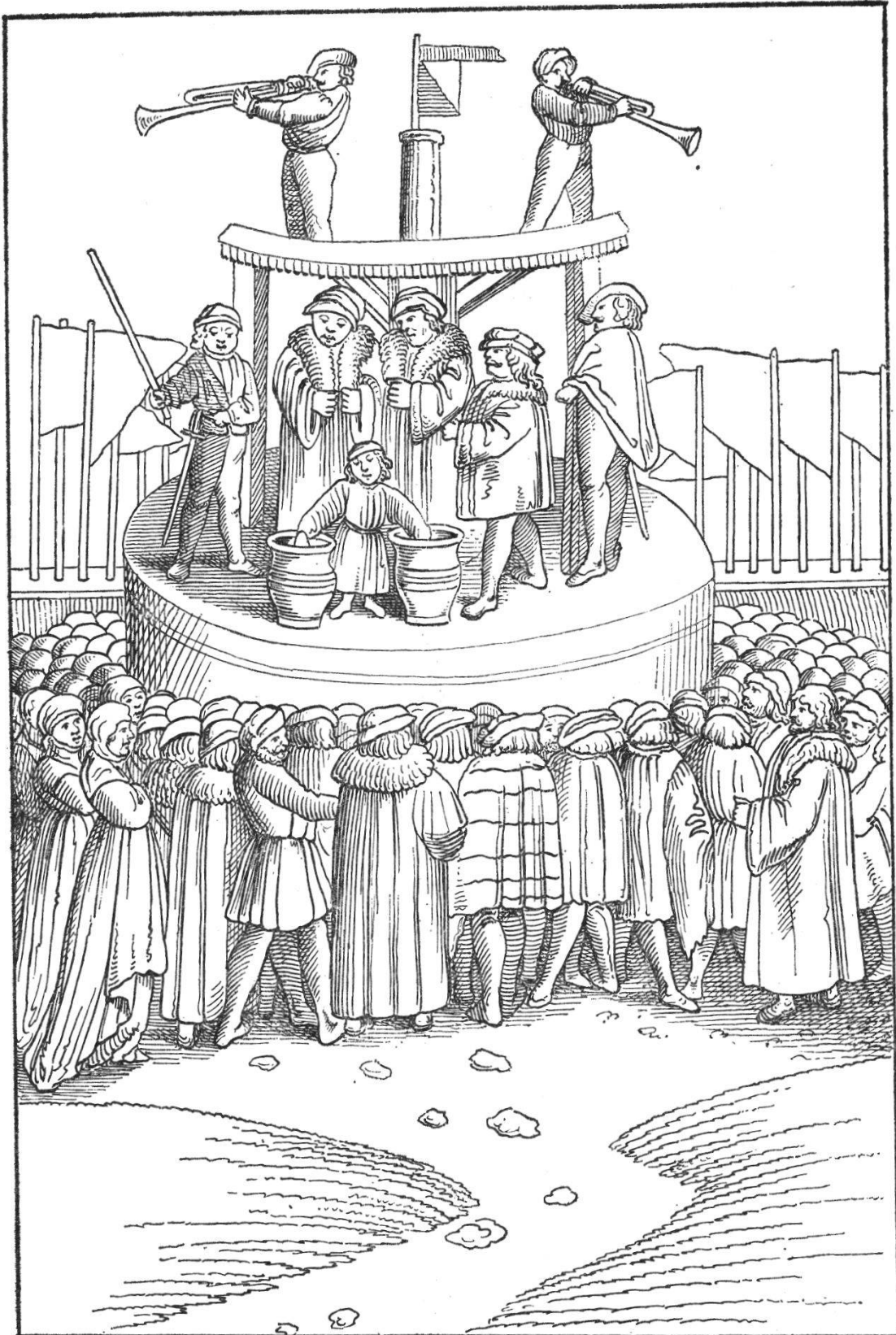
Das vfnemen der zedlen vs dem glückshafen ze Zürich den sechzehenden septembris 1504.