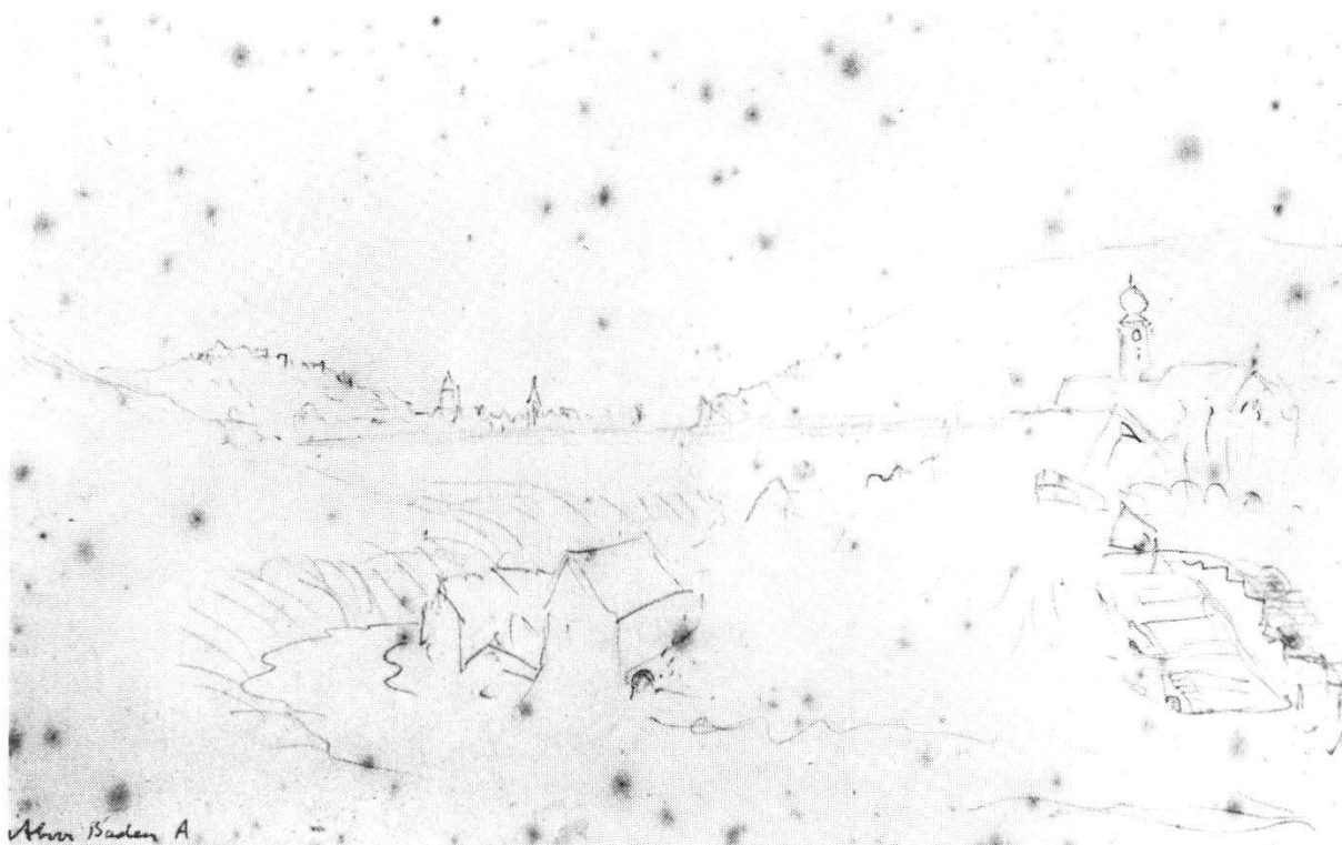
10 Aben Baden A

Es folgen nun 8 Zeichnungen, die sich alle im Besitz der Ruskin Galleries, Bembridge School, Isle of Wight, befinden. Dort sind sie unter den Nummern 1131–1138 katalogisiert.