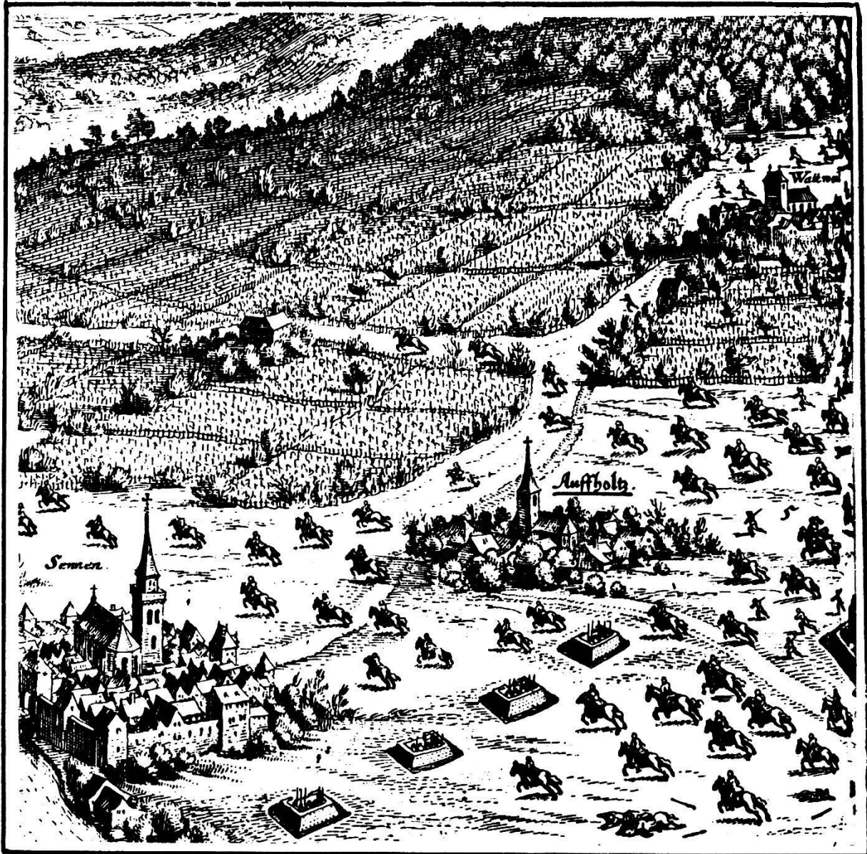
Ausschnitt aus dem Kupferstich des Baslers Merian: «Die Feldschlacht bei Wattwiller» (Theatrum Europaeum, 1634). Oben rechts «Wattweil» (Wattwiller), unten links «Sennen» (Cernay); dazwischen «Auffholtz» (Uffholtz), das zur Vogtei Wattwiller gehörte. Die Kapelle mitten im Rebberg ist die St.-Antoni-Kapelle.

des hochwürdigsten, durchlechtigsten, großmächtigen Fürsten und Herren, Herrn Leopolden Erzherzogen zu Oesterreich, Herzogen zu Burgundt, Steür, Kärndten, Crain unnd Würtenberg, Bischoffen zu Straßburg und Passau, Administrator beeder fürst. Stüfften Muerbach und Luders, Landgraffen in Elsaß, Grafen zu Ha(b)spurg, Tyrol unnd Görz, meines Gnedigsten Fürsten Vogt und Amtmann der Herrschafften Wattweyler unnd Uffholtz» (Berein, Uffholtz, 1623).