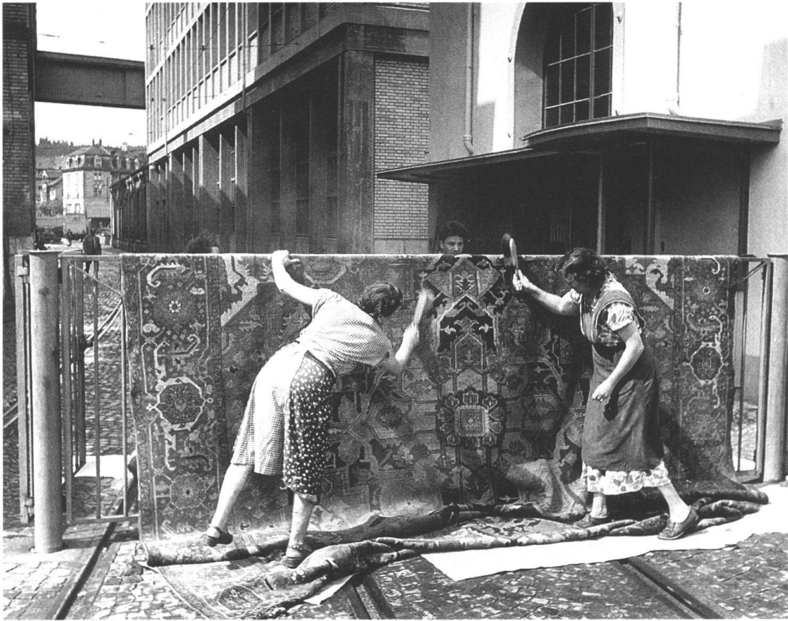
Teppichklopperinnen der Maschinenfabrik Oerlikon (Foto Jakob Tuggener, 1952).