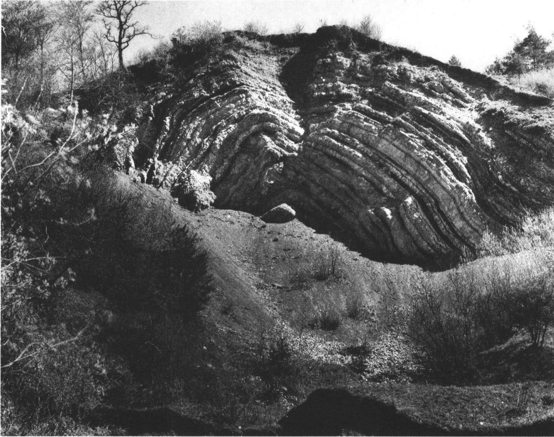
Gipsgrube mit «versteinertem Regenbogen» um 1960. (Aargauer Volksblatt, 10. November 1962)