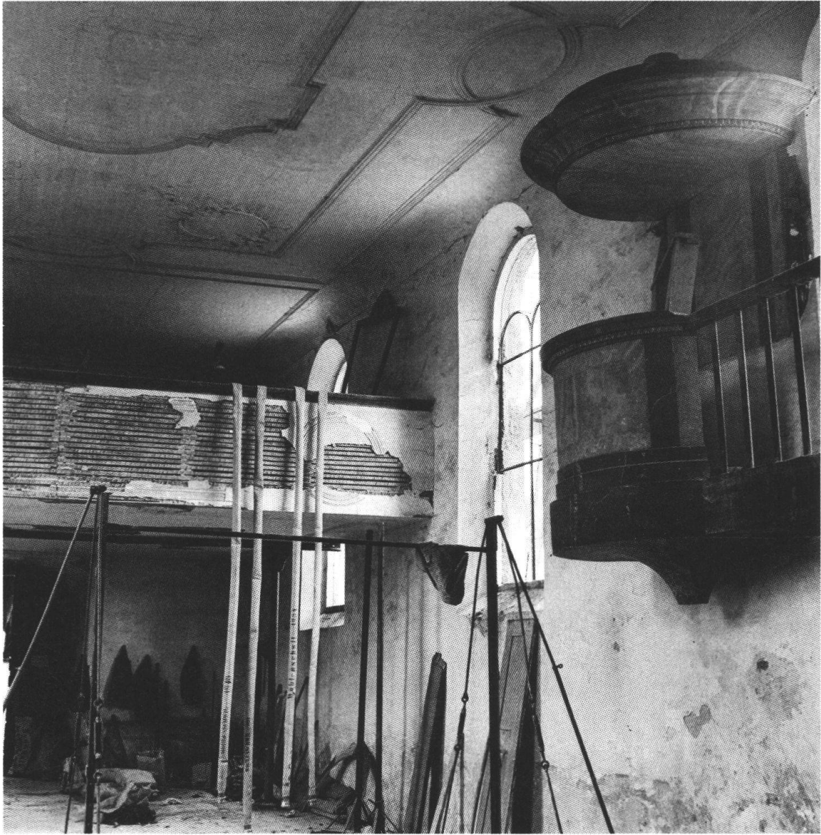
Wohlenschwil, Alte Kirche. Inneres gegen die Empore vor 1953.