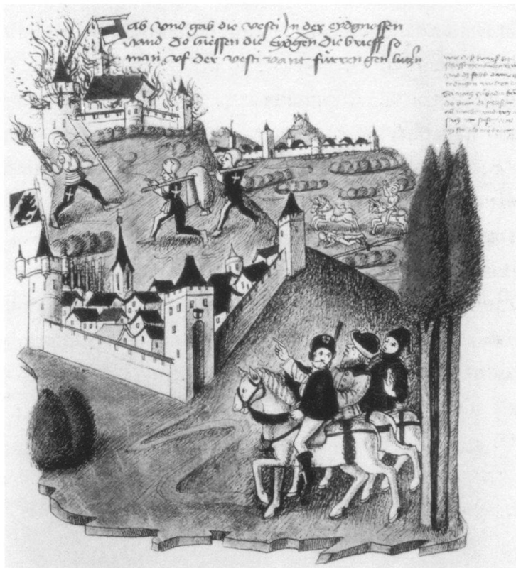
Abrupter Untergang einer stolzen Burg: Im Mai 1415 plndern die Eidgenossen den Stein, weniger wehrhafte Festung als Symbol habsburgischer Herrschaft. Die auf der um 1470 entstandenen Darstellung des Berner Chronisten Bendicht Tschachtlan erkennbaren Boten von Knig Sigismund vermgen die Zerstrung der Burg nicht mehr zu verhindern.