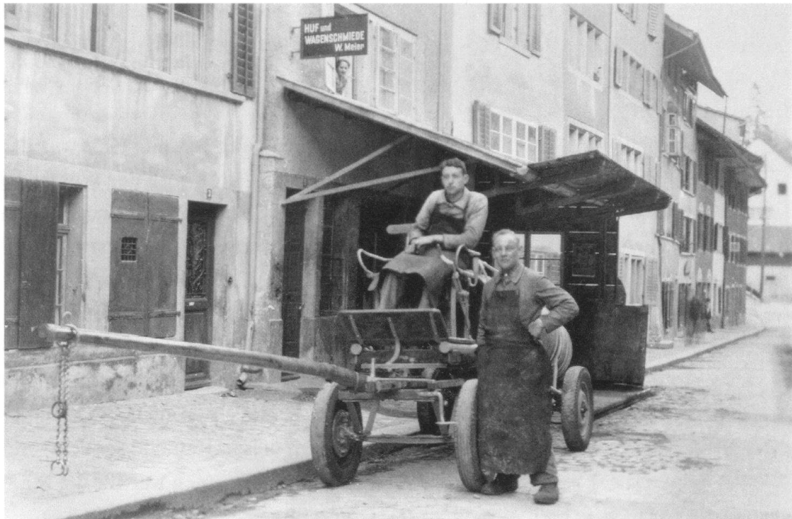
Die westliche Häuserreihe der Kronengasse nach 1940. Die Pferde sind ausgespannt und warten in der Schmiede auf neuen Beschlag. Der Geselle des Schmiedemeisters (stehend) und sein Gehilfe (auf dem Bock) posieren mit dem Güllenfasswagen eines Kunden (Historisches Museum Baden, Q 01.17907).