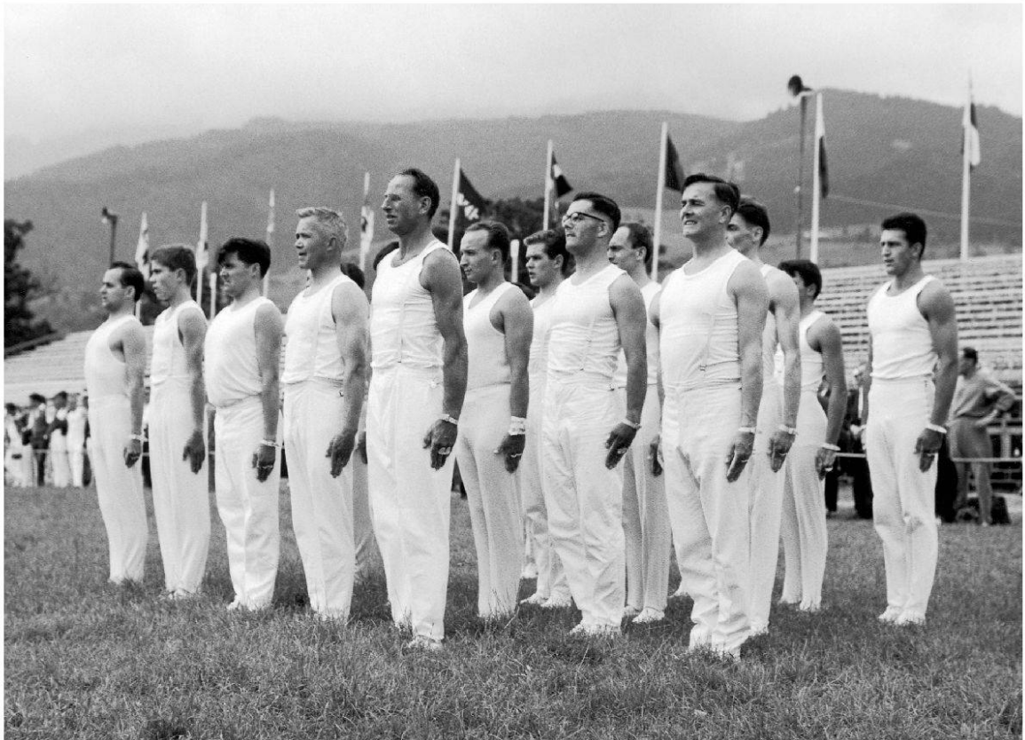
Eidgenössisches Turnfest in Luzern 1963 (alle Bilder: Archiv STV Wettingen).