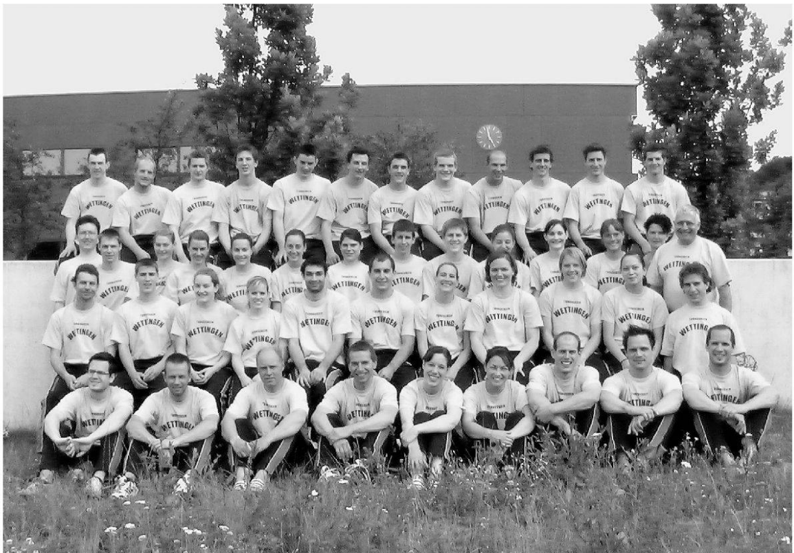
Gruppenfotos 1984 und 2004.