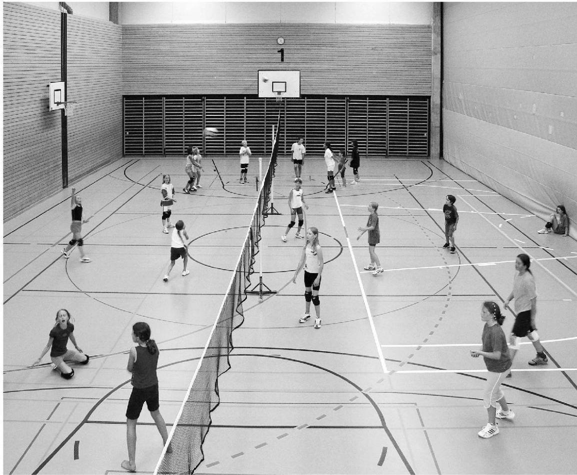
Arbeit mit dem Mini-Team heute (Bild: Claudia Binder).