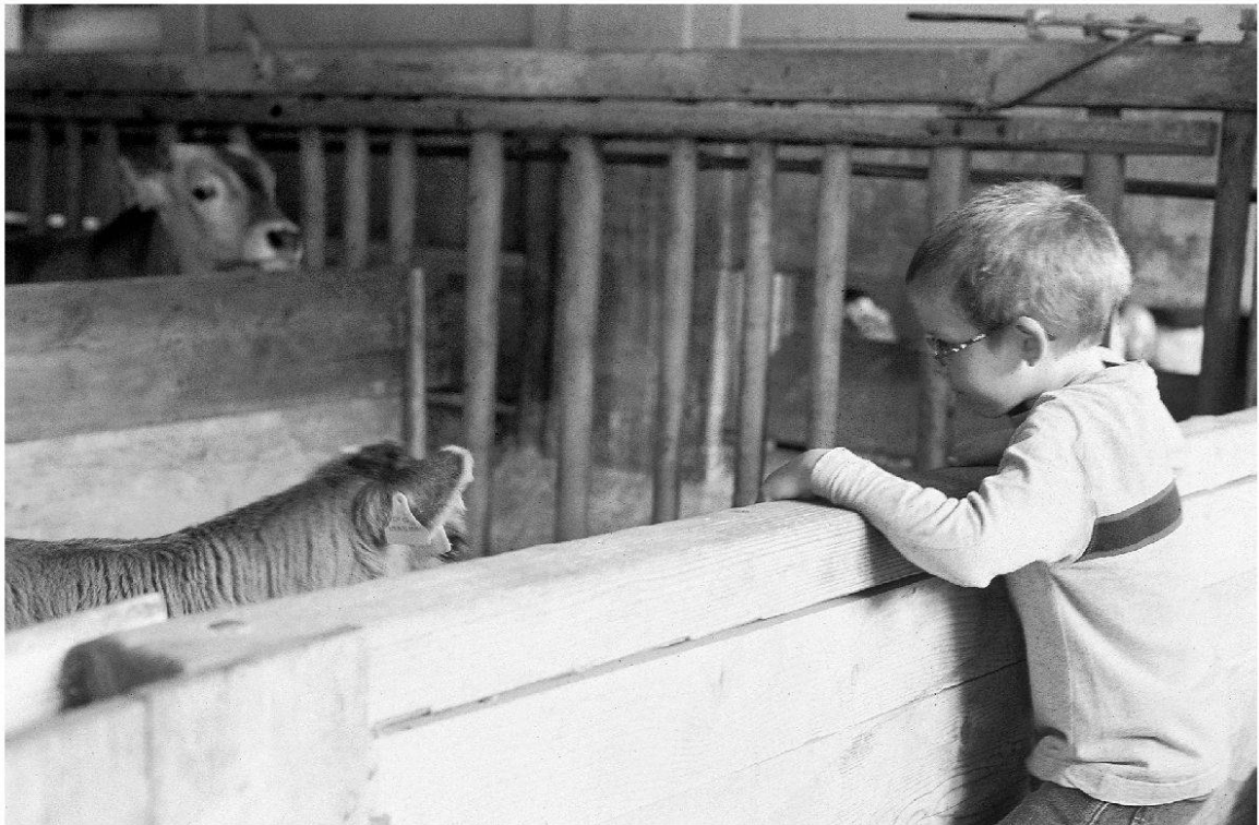
Der Hochstrasshof als Ort für erste Begegnungen zwischen Stadtkindern und Bauernhof-tieren.