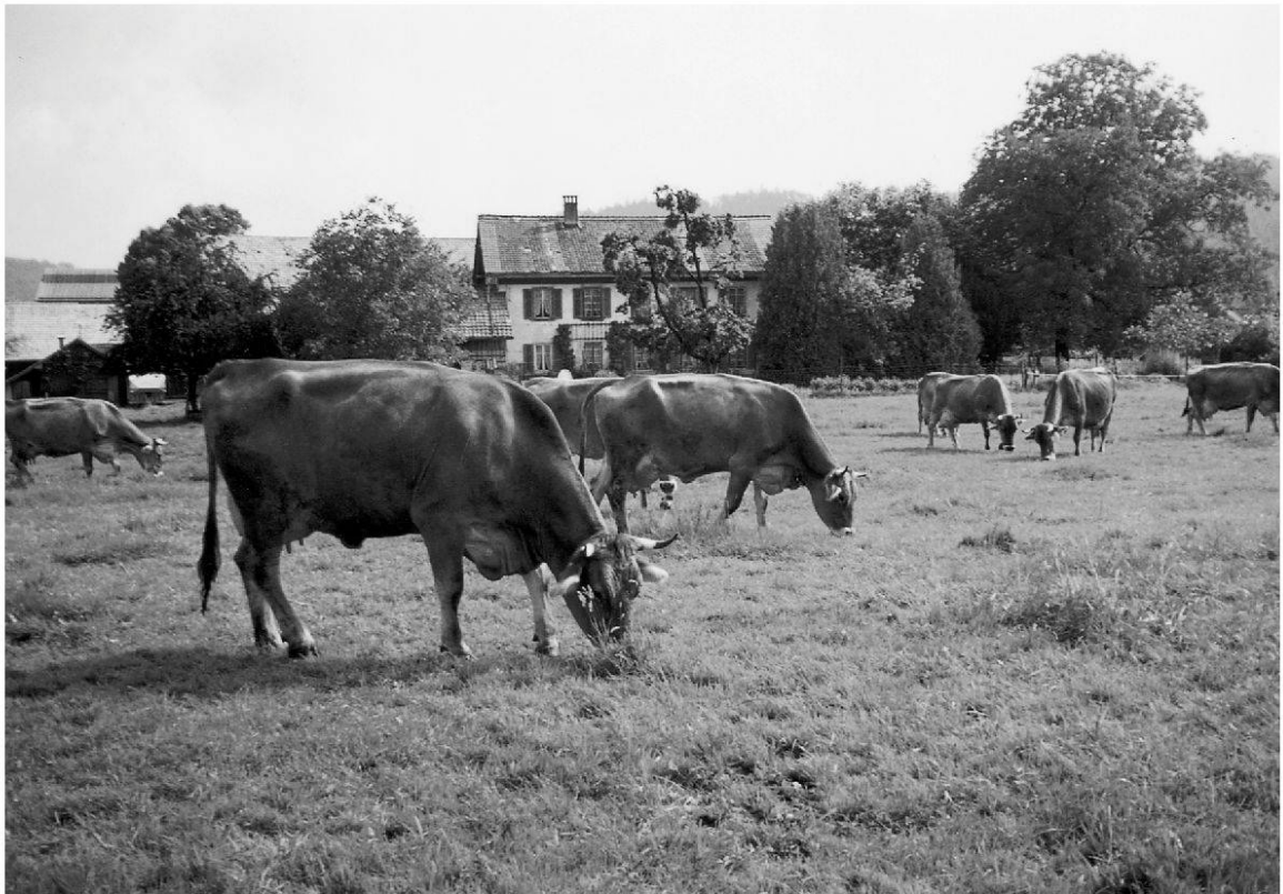
Ansicht des Hochstrasshofs von der Pilgerstrasse, 1997 (Bild: Eugen Kaufmann).