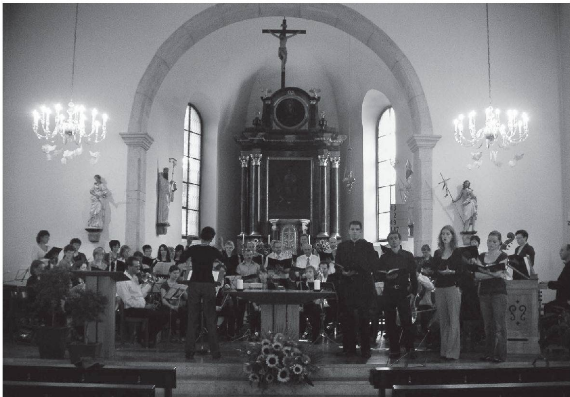
Der Kirchenchor in der Kirche Kirchdorf.