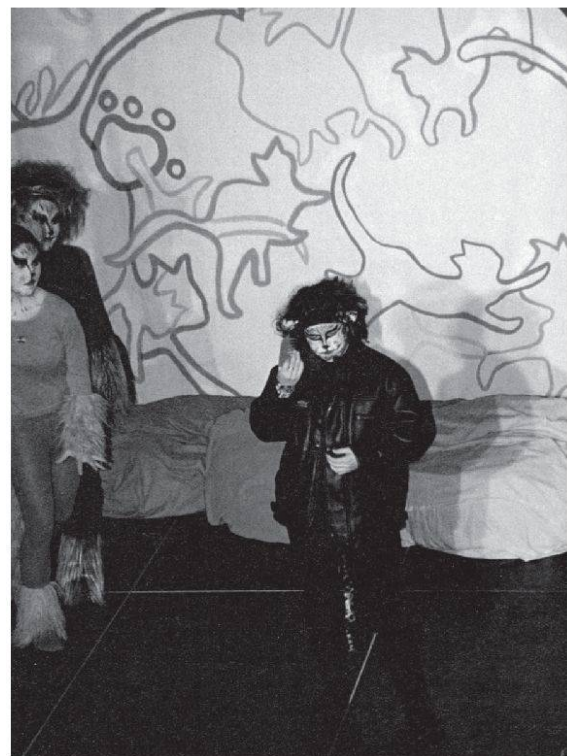
Das Musical «Cats», 2003.