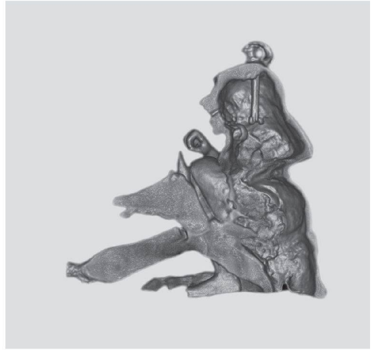
Abb. 5: Die Gorgo von Baden. Virtueller Schnitt mit Hilfe der Neutronentomografie.