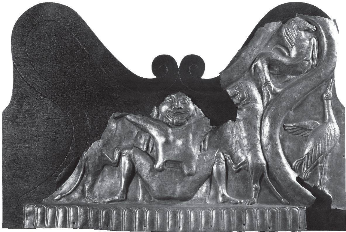
Abb. 6: Bronzebeschlag eines Wagens mit der Darstellung der hockenden Gorgo aus einem etruskischen Fürstengrab von Castel San Mariano. Höhe 40,1 cm (nach: Deschler-Erb, Eckhard u. a. [wie Anm. 1], 14, Abb. 15).