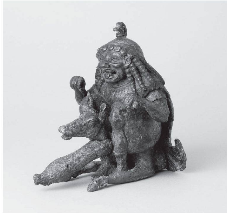
Abb. 3: Die Gorgo von Baden. Schrägansichten von rechts und links. Die Höhe der Figur beträgt 17 cm.