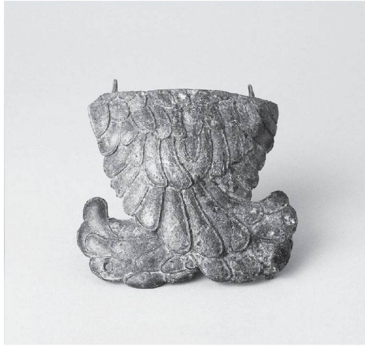
Abb. 4: Die Gorgo von Baden. Detailansicht der beweglich angebrachten Flügel. Die Höhe der Flügel beträgt 9,2 cm (Foto: Dominik Golob).