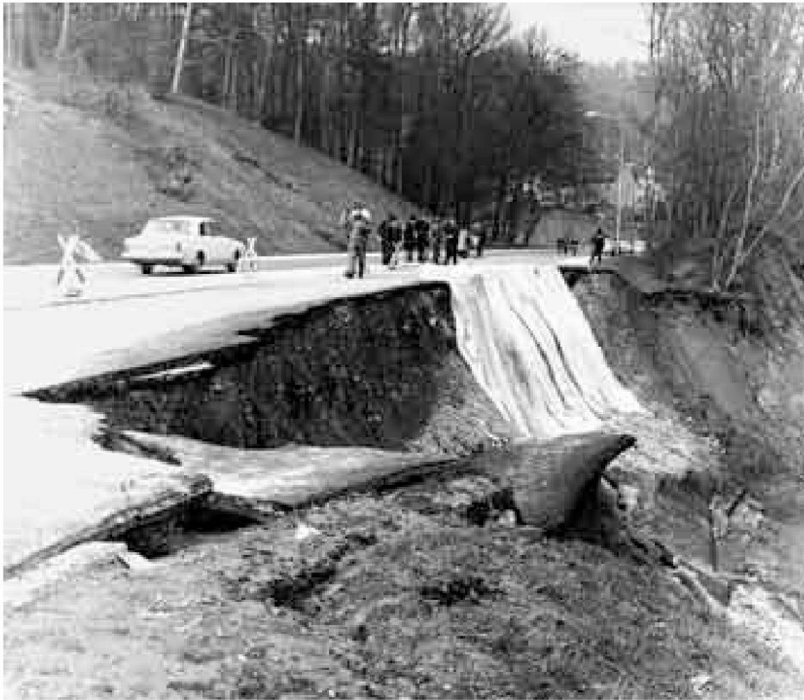
29. März 1964, Neuenhoferstrasse, Baden, Blickrichtung Baden. 40 000 Kubikmeter Erdreich hatten sich in Bewegung gesetzt. Fachleute begutachten den Schaden (Stadtarchiv Baden, E.32.266).