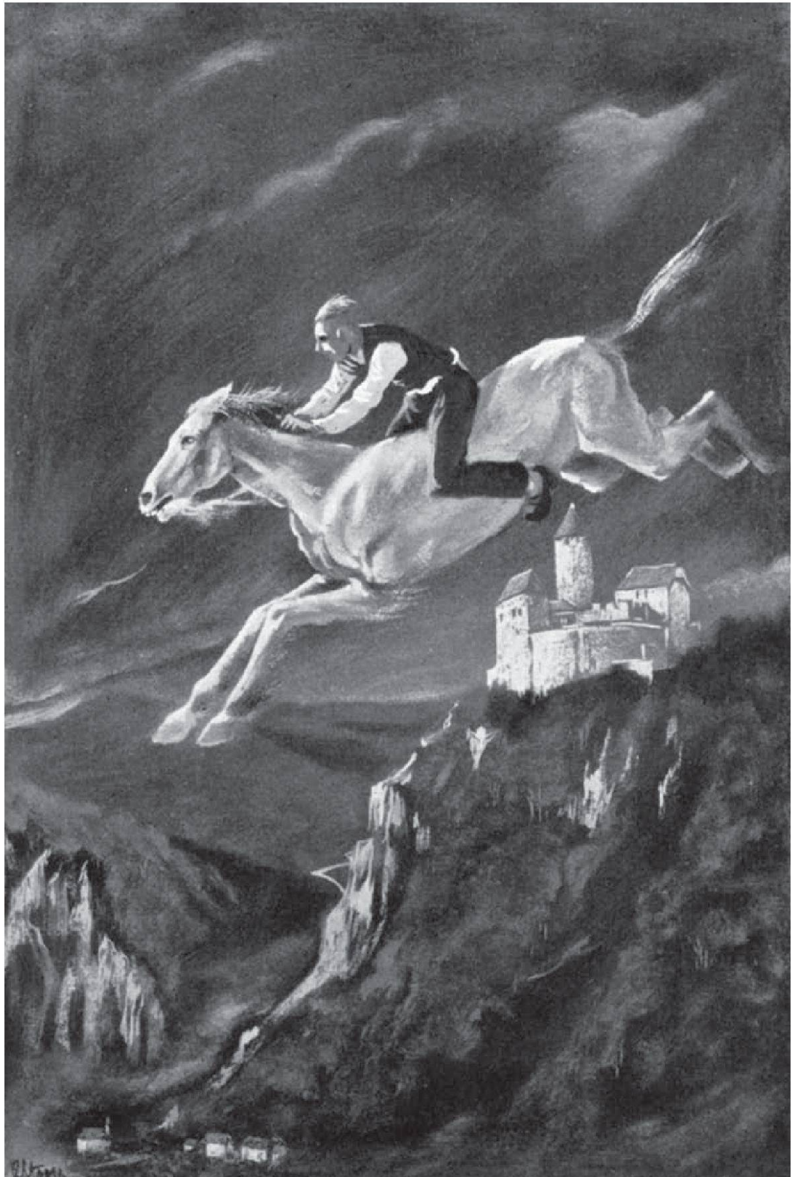
Abb. 1: Ein Schimmel fliegt von St. Gallen nach Baden. Aquarell von Robert Stoop, Zürich. Original verschollen.