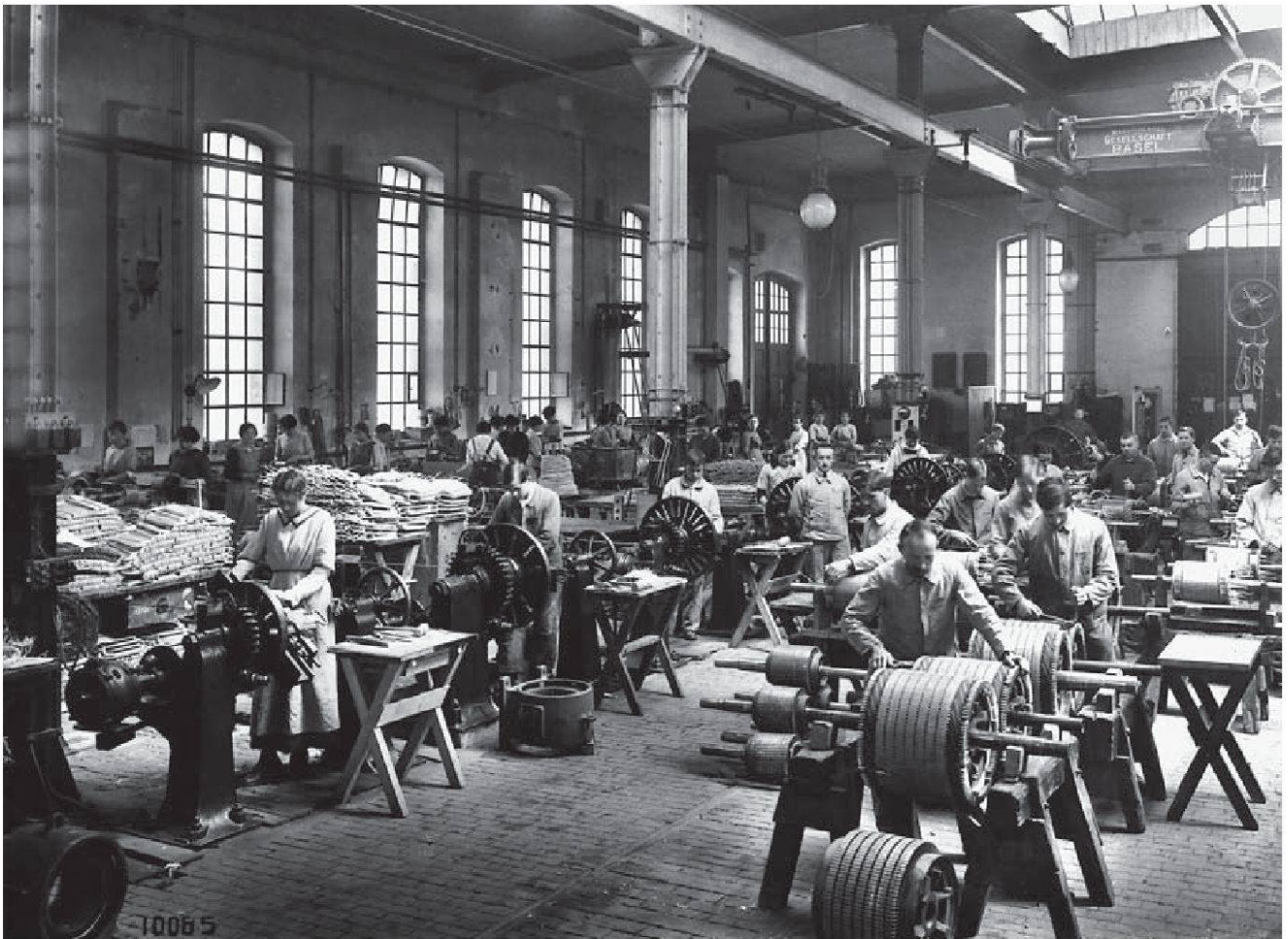
Abb. 3: In einer Werkhalle von BBC werden um 1918 Motoren gewickelt. Wie bei Fritz Frei geschildert, trägt der Werkmeister zwar ein Überkleid, hebt sich aber mit der Krawatte von den Arbeiterinnen und Arbeitern ab.