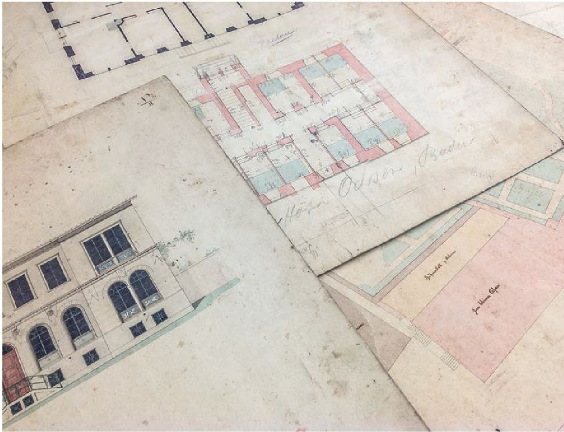
Pläne des Badener Architekten Caspar Joseph Jeuch um 1842 für die Dépendance des «Ochsen», aufgefunden auf dem Estrich des «Verenahofs».