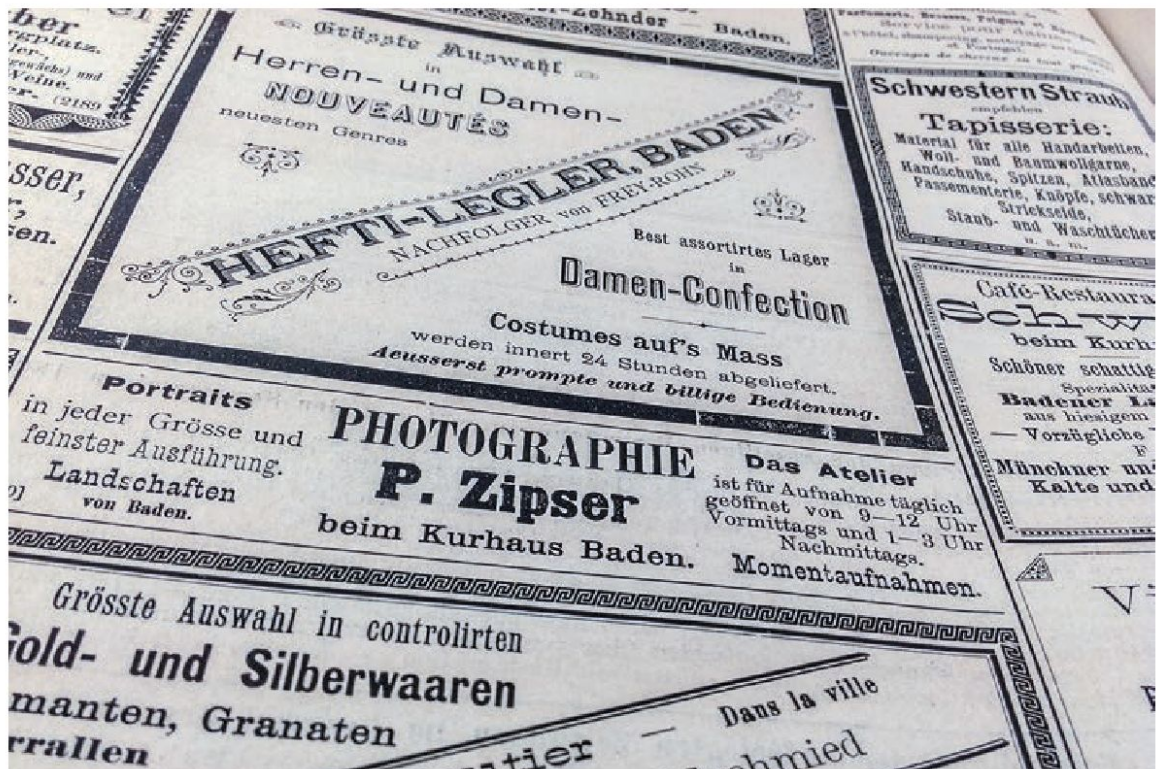
Wer logierte im «Grand Hôtel», wer im «Ochsen»? Gästelisten im Fremdenblatt, Mai 1890.