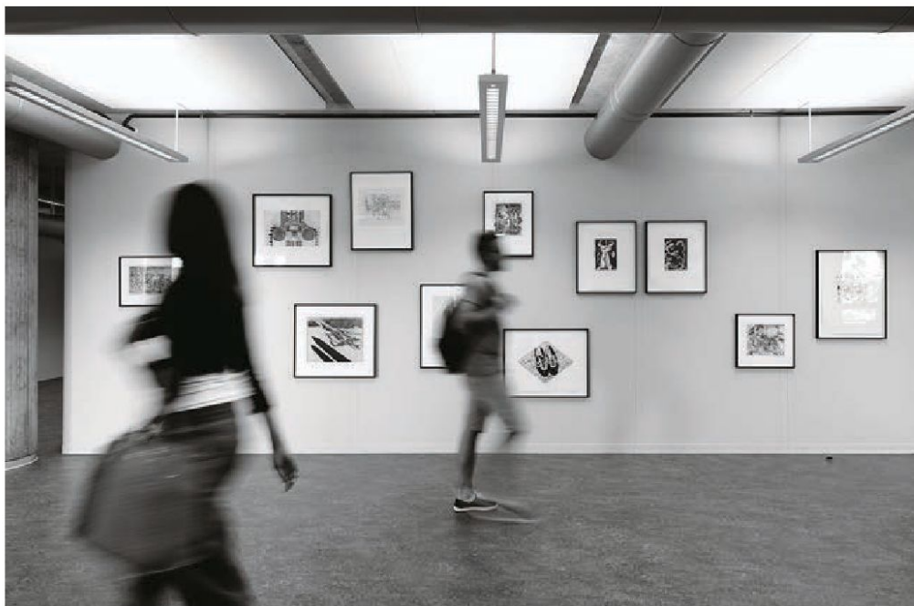
Oscar Wiggli, GK 18k, 1970.