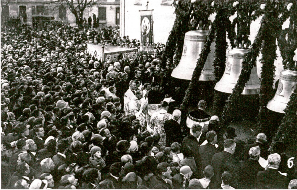
Stadtkirche Baden, 28. November 1926, Bischof Josephus Ambühl weiht das neue Geläut. Am darauffolgenden 1. November werden die Glocken von den Schulkindern in den «Chrälleliturm» hochgezogen.