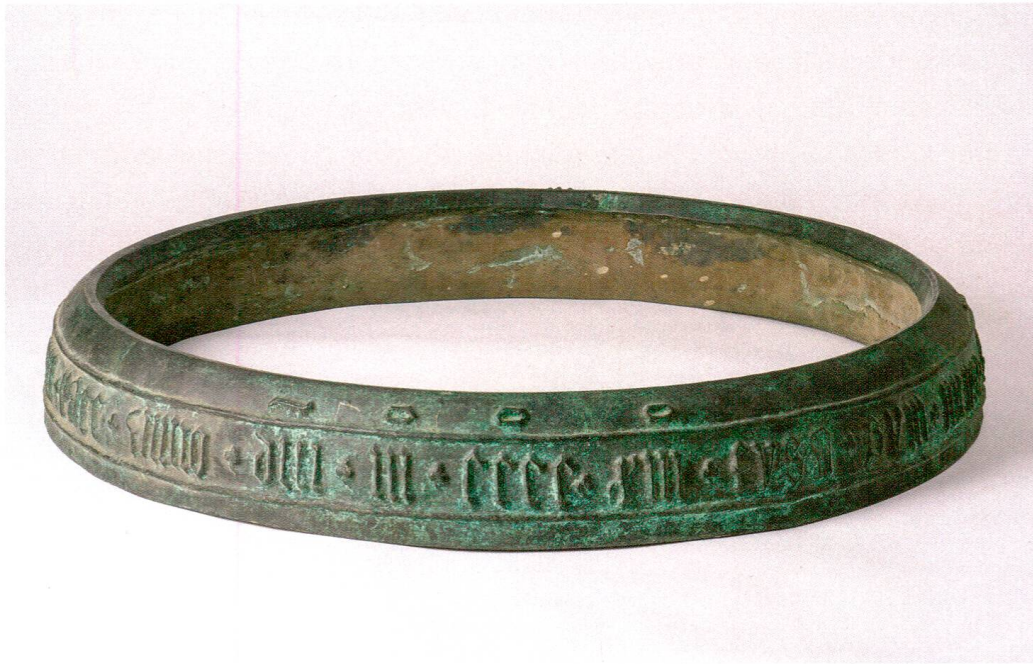
Bronzeabguss des Schlagrings der Mittagsglocke, die 1413 von Johannes Reber in Aarau für die Stadtkirche Maria Himmelfahrt Baden gegossen wurde. Es handelt sich um eine Kopie des Originals, das bei Rüetschi AG, Aarau, als ältestes Zeugnis der Aarauer Glockengussstradition aufbewahrt wird. Historisches Museum Baden.