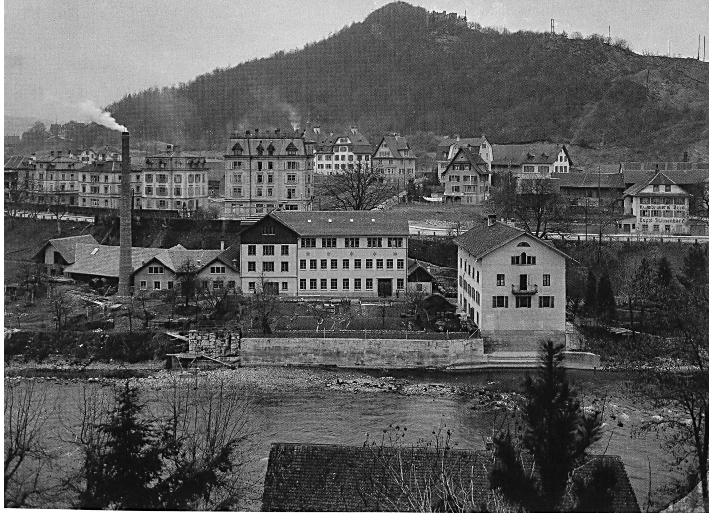
Fabrik Streule & Cie. im Jahr 1918