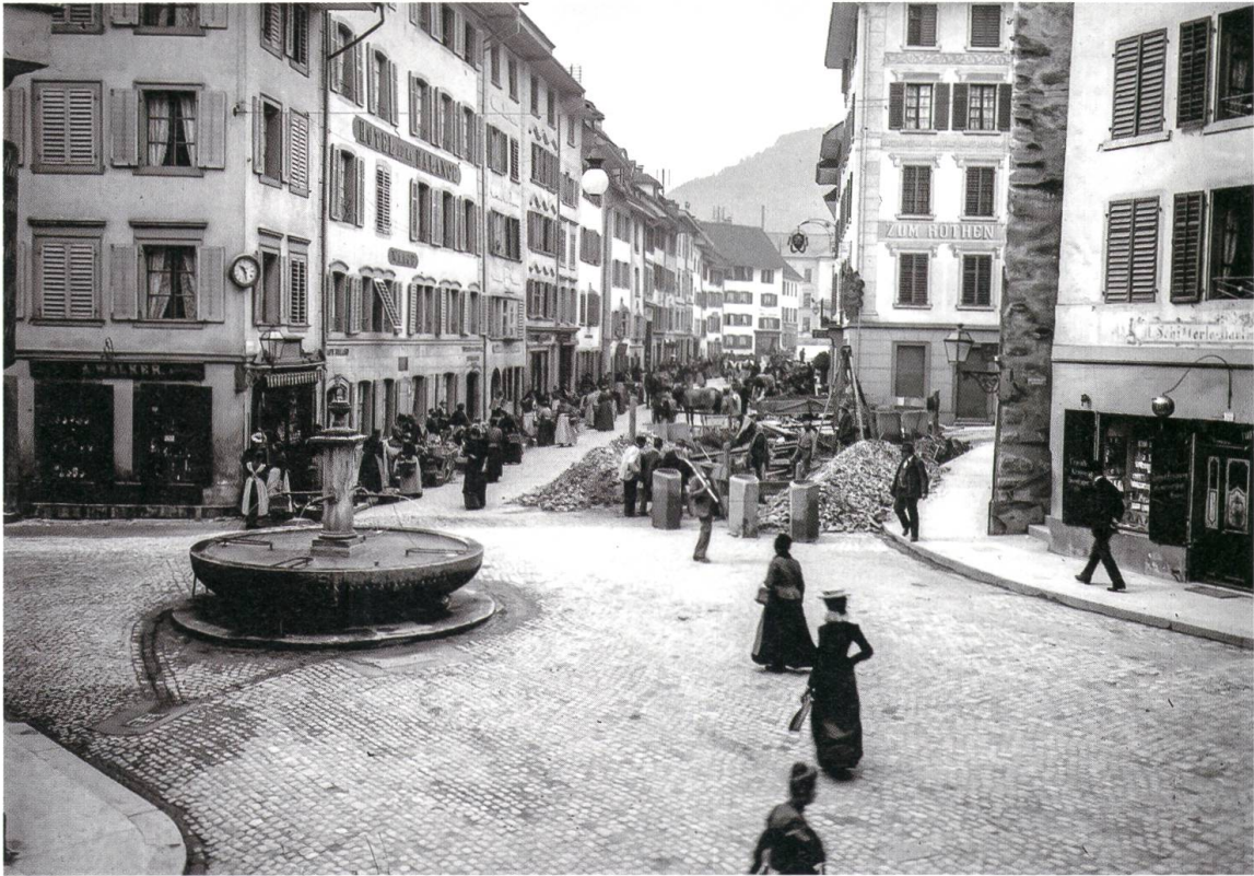
In der Weiten Gasse fand um 1900 der Wochenmarkt statt, wie heute wieder. Der Stadtbach war nach 1850 zugedeckt worden, da man die Gasse mit dem Abbruch des Franzosenhauses für den Verkehr öffnen wollte.