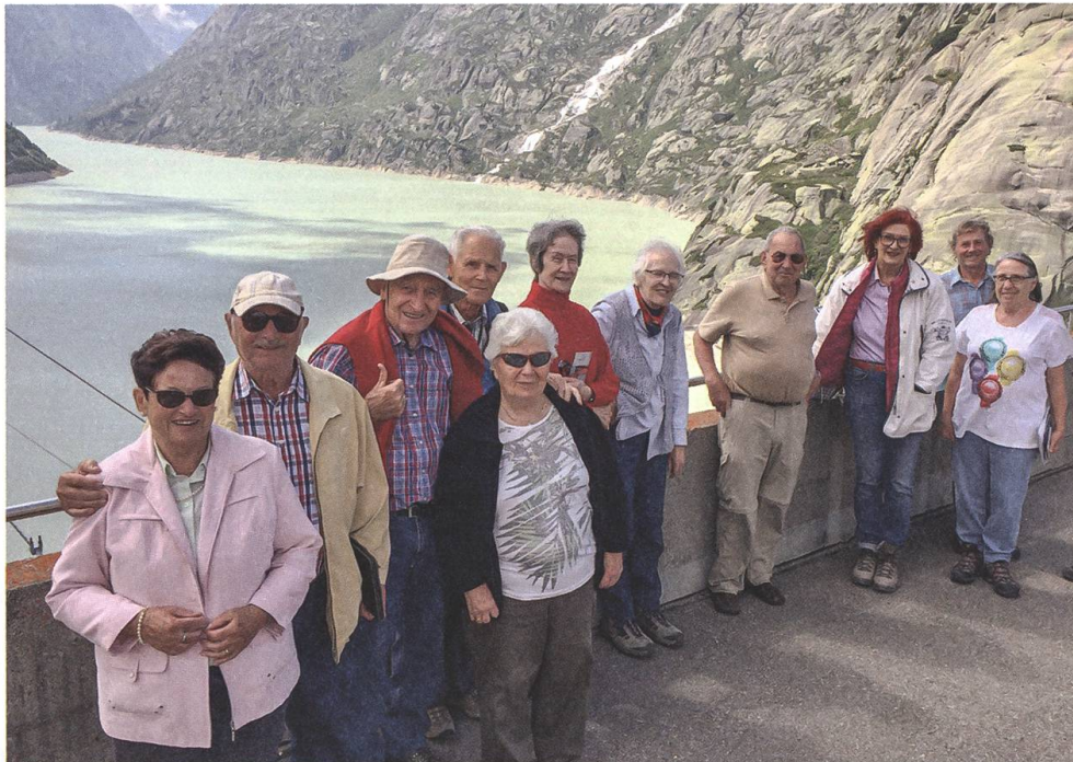
Die Exkursionsgruppe am 29. August 2020 beim Grimsel Hospiz, im Hintergrund der Stausee.