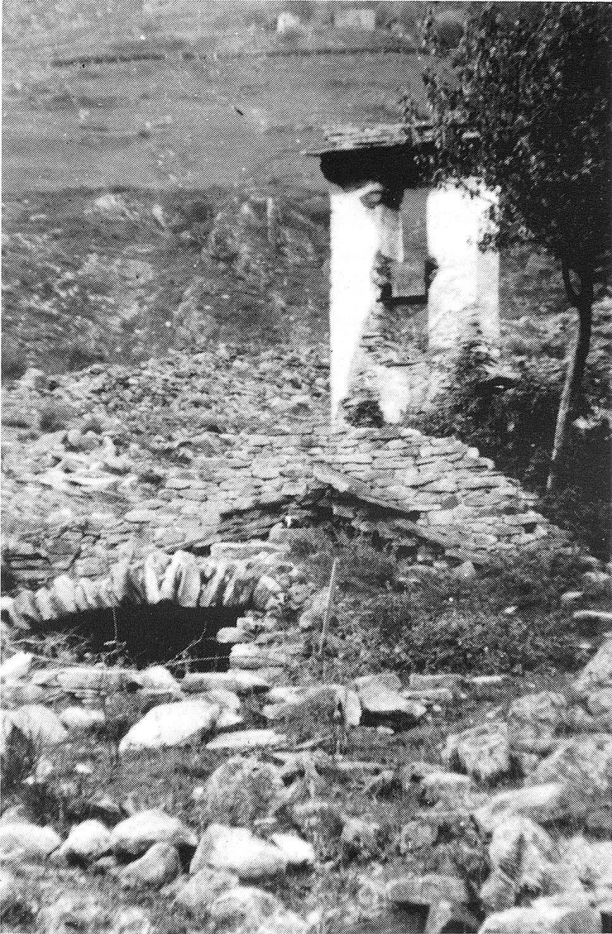
Oratorio della Natività