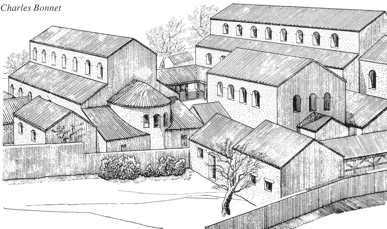
Una ricostruzione ideale del gruppo episcopale

Gli scavi archeologici condotti da più di 30 anni, hanno apportato nuove conoscenze sulla storia dei primi tempi cristiani.