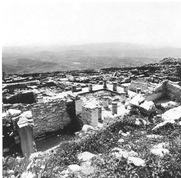
Visione d'insieme degli scavi da nord-est. In primo piano la casa a peristilio 1.

Bagni con vasche incorporate, in muratura, si riscontrano assai raramente in dimore private di epoca greca. Non a caso è proprio in Sicilia che ne esiste qualche altro esempio. Sembra trattarsi di una comodità diffusa più nelle ricche zone periferiche del mondo greco che non nella Grecia stessa. Bagni in case private sono, a quell'epoca, frequenti anche a Cartagine e nei suoi dintorni.