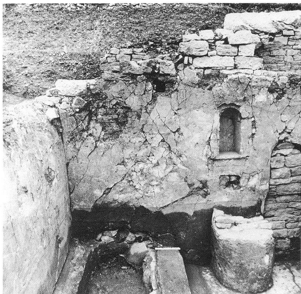
La casa a peristilio I, veduta del bagno (21) con le condotte dell'acqua corrente

La superficie abitata in totale era, se escludiamo il vuoto dei cortili al piano superiore, di 1608 metri quadrati. Va però ricordato che tutta la parte occidentale della pianta, con i vani 20 a 25, è un ampliamento secondario, costruito circa mezzo secolo dopo il resto della casa.