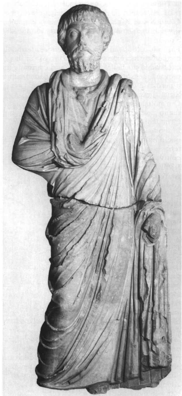
Statua ritratto di Neocle, marmo, 187 d.C.

- M. Karabelnik (red.), Aus den Schatzkammern Eurasiens. Meisterwerke antiker Kunst . Kunsthau Zürich, 1993 (Direttore: Felix Baumann).