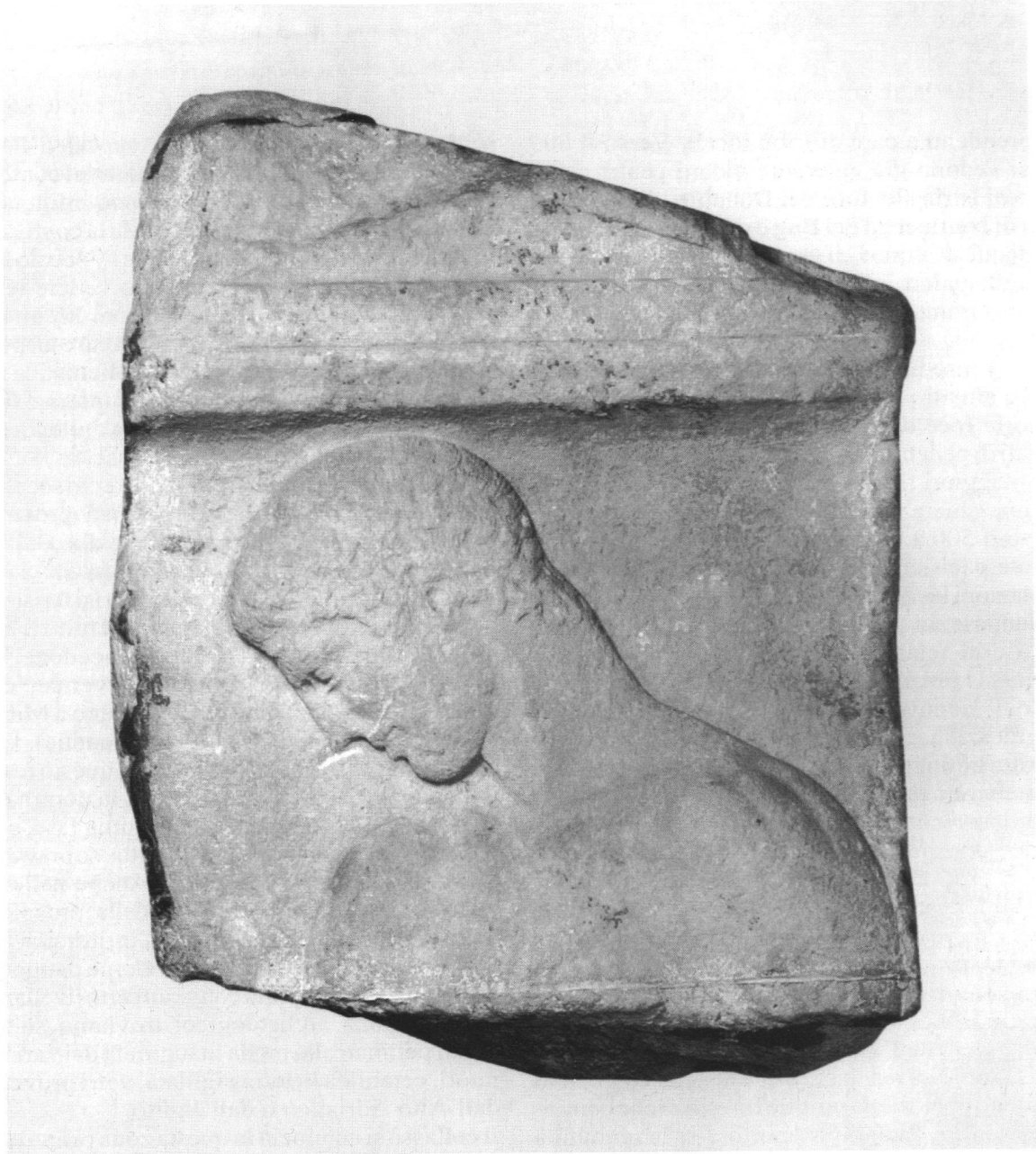
Frammento stele funeraria, marmo ca. 450 a.C.

greca, il che, oltre a conflitti fra centri contigui, dà origine, a partire dall'VIII secolo a.C., anche a un impressionante moto di colonizzazione.