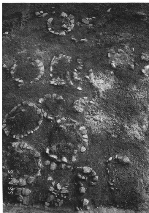
Solduno: area delle necropoli all'inizio dello scavo. Si leggono le sovraccoperture delle tombe appartenenti all'età del ferro

Ritrovamenti di grande importanza, questi di Solduno, che vanno ad aggiungersi ai numerosi reperti riportati alla luce già negli anni scorsi. Infatti l'area locarnese è nota per l'interesse archeologico sino dalla seconda metà dell'Ottocento. Numerosi testi sono stati dedicati all'argomento fin dagli anni quaranta. Nel 1941 Christoph Simonett pubblicava un'ampia monografia dedicata agli scavi archeologici condotti a Solduno, Muralto, Minusio e Stabio negli anni 1936-1937. Tale testo venne poi tradotto in italiano e pubblicato integralmente sull'Archivio Storico fra il 1967 e il 1971. Nel 1943, Aldo Crivelli dava alle stampe il suo prezioso "Atlante preistorico e storico della Svizzera italiana" - poi ripubblicato nel 1990 dall'AAT - nel quale vengono elencati i reperti appartenenti alle varie epoche, riportati alla luce alla fine dell'Ottocento. Alla luce di nuovi ritrovamenti, la necropoli romana di Solduno venne poi riconsiderata da Pierangelo Donati nel 1979, quando pubblicò il terzo Quaderno d'Informazione dell'Ufficio cantonale dei monumenti storici -