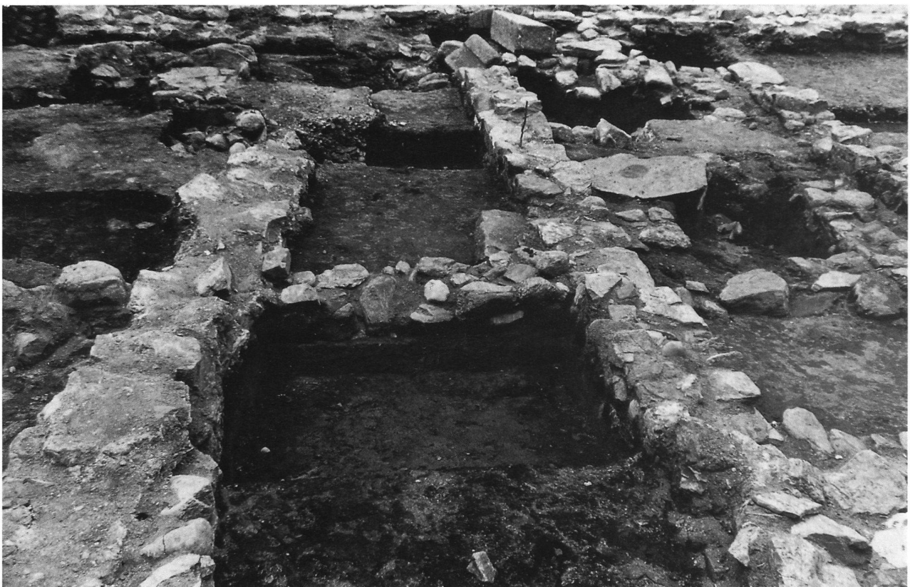
Una veduta degli scavi nel quartiere Maghetti

RENFREW D.J., 1973, Palaeoethnobotany , New York