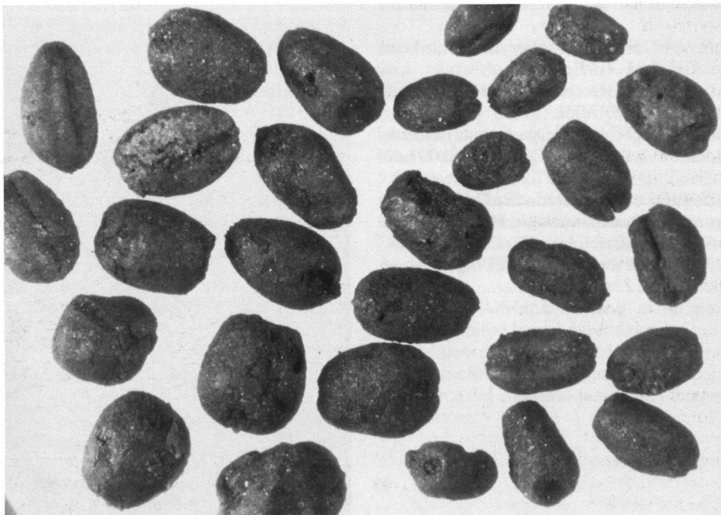
Gruppo di cariossidi di frumento comune ( Triticum aestivum / compactum ): presso i resti degli edifici medievali del Legato Maghetti a Lugano ne sono state rinvenute quasi 5000, da cui si è dedotto il ruolo importante di questo cereale nell'alimentazione del tempo.

I resti botanici macroscopici, termine usato per materiali di dimensioni tali da essere visibili a