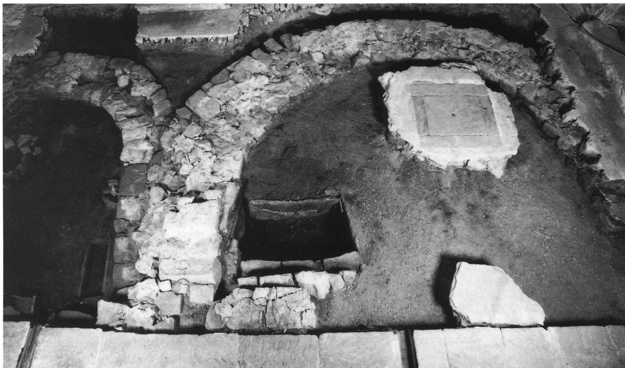
Chiggiogna - Chiesa di Santa Maria. Il raddoppiamento della navata e del coro nella fase trecentesca

E all'importante storia degli edifici religiosi ticinesi si stanno aggiungendo nuovi elementi anche nel momento di stesura di questo breve testo. La nostra équipe di scavo è infatti attualmente impegnata sulla piazza antistante la parrocchiale di San Maurizio a Bioggio, dove già sono emersi i resti della chiesa romanica e di quella preromanica. Una conferma dell'antichità di Bioggio, dove rammentiamo sono già state riportate alla luce negli scorsi anni una villa e un tempio romano, oltre alle fasi pre-millenarie racchiuse nella chiesa di Sant'Ilario.