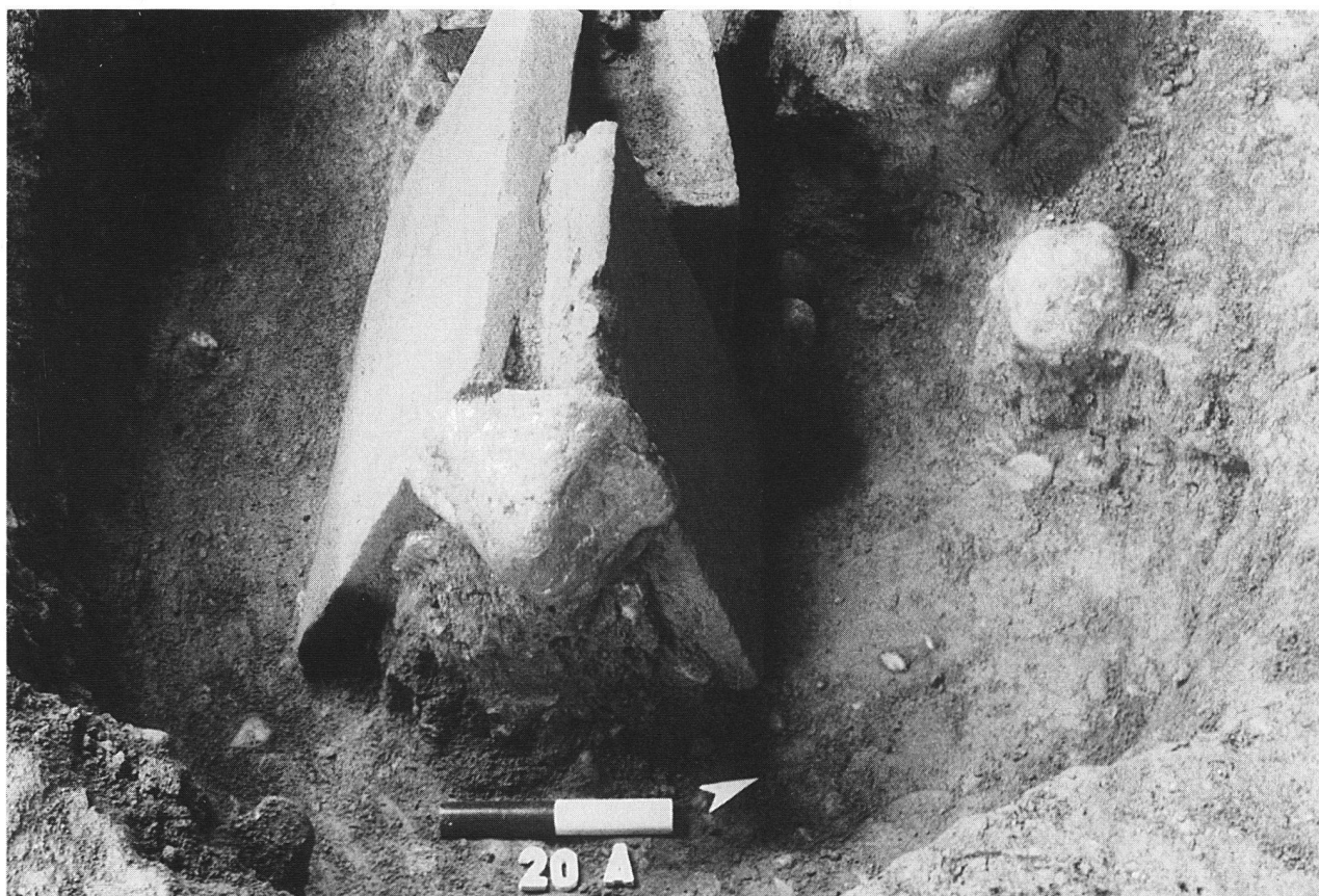
Tomba 20/1997, struttura tombale «alla cappuccina»

delle tombe portò la Società Archeologica Comense a rinnovare, attraverso i suoi soci locali, il controllo sul territorio della cittadina: questa appassionata vigilanza ha portato negli ultimi decenni alla segnalazione alla Soprintendenza di lavori edili in aree ad alto rischio archeologico e ciò ha consentito altri fortunati ritrovamenti, tra cui quelli, per restare alla fase romana, nell'area detta Fontanone e nella zona del mercato nuovo (via Kennedy), ritrovamenti che hanno fornito interessanti informazioni sull'abitato antico di Mariano 2 . Anche intorno alla via Tommaso Grossi si intensificarono i controlli, nella certezza che le centotrenta tombe recuperate dovevano essere solo una parte dell'area cimiteriale; tale certezza derivava in particolare da alcuni sondaggi effettuati poco al di sotto delle fondazioni di un capannone industriale che lambiva la strada, sondaggi che avevano portato all'individuazione di altre sepolture. Così nel 1996 i volontari hanno potuto tempestivamente segnalare alla Soprintendenza Archeolo-