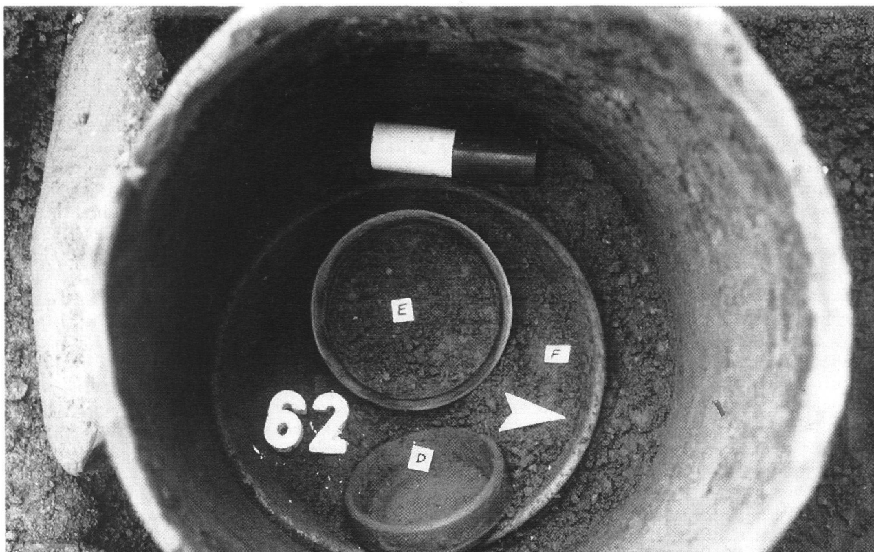
Tomba 62/1998: particolare del corredo all'interno della sepoltura in anfora segata. La lettera E indica la coppa baccellata in vetro