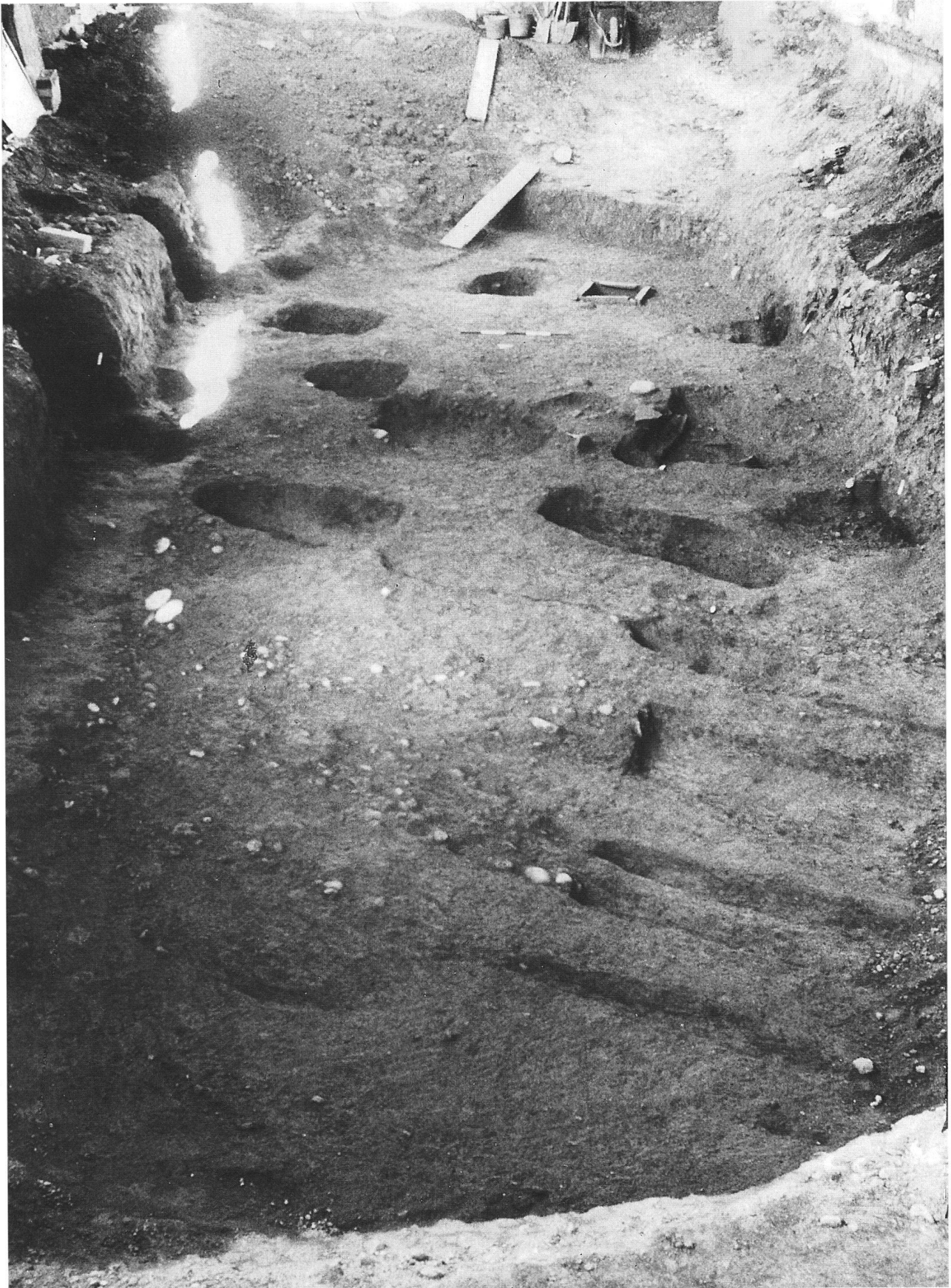
Visione generale dell'area di scavo (luglio 1997): in basso si notano i solchi lasciati dai carri lungo la strada che lambiva la necropoli