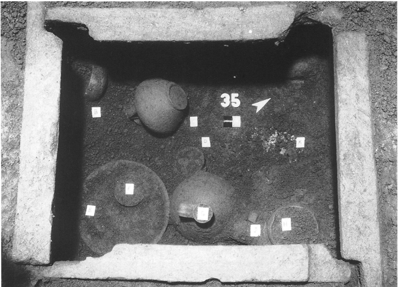
Tomba 35/1997: particolare del corredo all'interno della struttura a cassetta di tegoloni