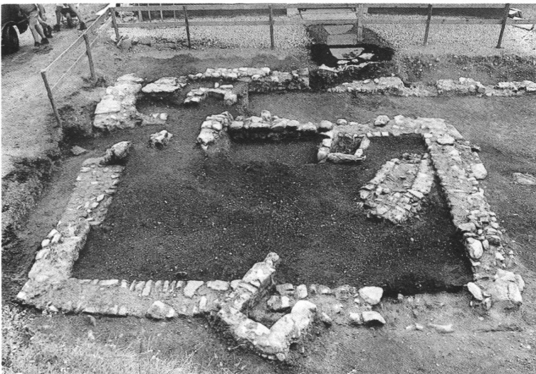
Fig. 2. Castel San Pietro - particolare della struttura e di alcune sepolture