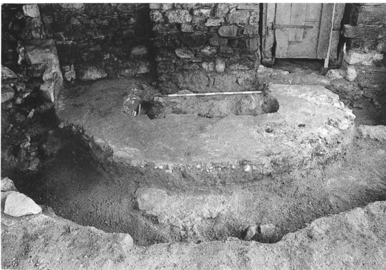
Fig. 3. Arogno-Pugerna - particolare della struttura absidale