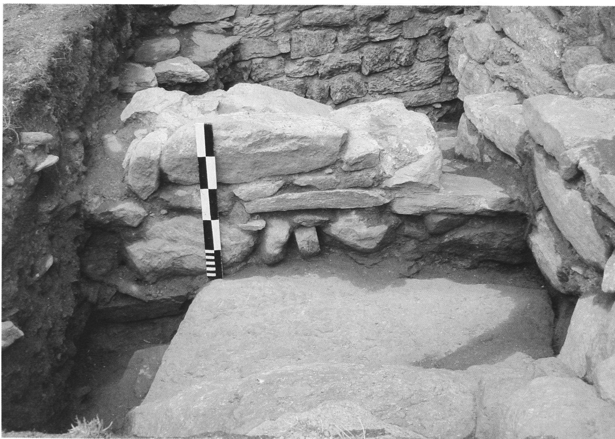
Fig. 5. Area 4, muro 19 in primo piano, cinta precedente, vista da est. Sullo sfondo attuale muro di cinta

Accanto a queste ricche testimonianze sono emersi elementi importanti riguardanti la costruzione del castello, in particolare risulta evidente dagli scavi come tutto il castello sia costruito direttamente sulla roccia e come gli architetti medioevali abbiano saputo adattarsi alla natura del terreno e abbiano sfruttato le irregolarità della roccia, anche dove questa improvvisamente assume una pendenza molto marcata creando un dislivello in alcune zone di diversi metri. Per creare dei locali ampi, sia il muro di cinta sia i locali interni sono stati direttamente costruiti alla