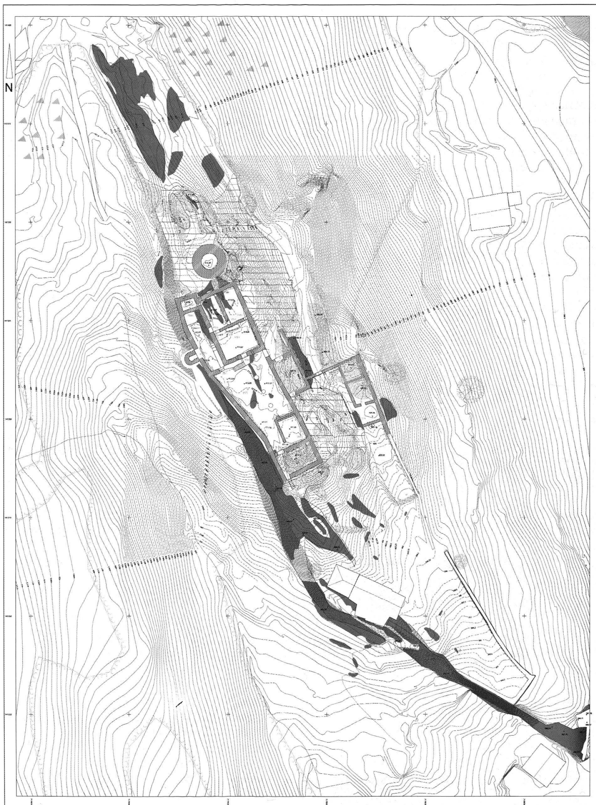
Fig. 3. Planimetria (1:200)